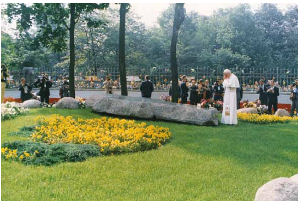
Papież Jan Paweł II u grobu ks. Jerzego Popiełuszki podczas trzeciej pielgrzymki do Polski. Warszawa, 14 czerwca 1987 r.