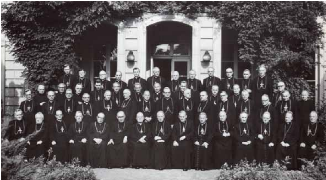
Kard. Stefan Wyszyński, prymas Polski wraz z episkopatem w trakcie Zebrania Plenarnego Konferencji Episkopatu Polski. Ogród Domu Arcybiskupów Warszawskich przy ul. Miodowej.