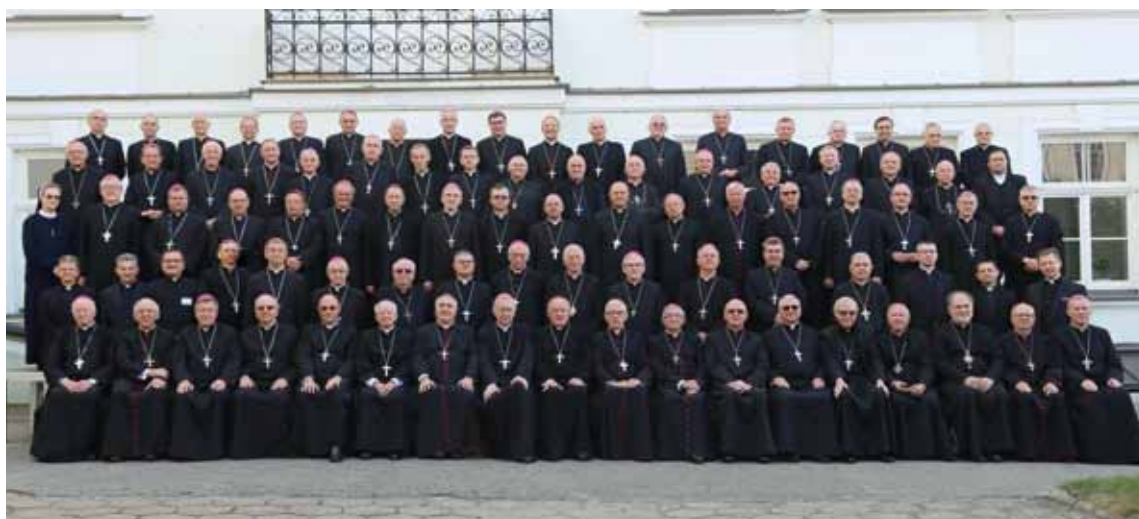
380. Zebranie Plenarne Konferencji Episkopatu Polski. Płock, 25-26 września 2018 r.