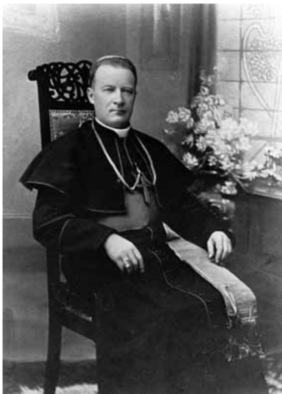
Abp Józef Bilczewski, metropolita lwowski.