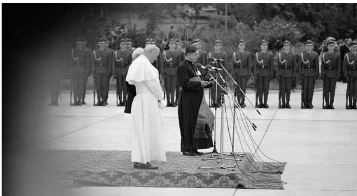
Powitanie papieża Jana Pawła II na lotnisku Okęcie w Warszawie, rozpoczynające drugą pielgrzymkę do Polski. Prymas Polski, kard. Józef Glemp (na podium z prawej) wygłasza przemówienie. Na podium z lewej widoczny papież Jan Paweł II. Warszawa, 16 czerwca 1983 r.