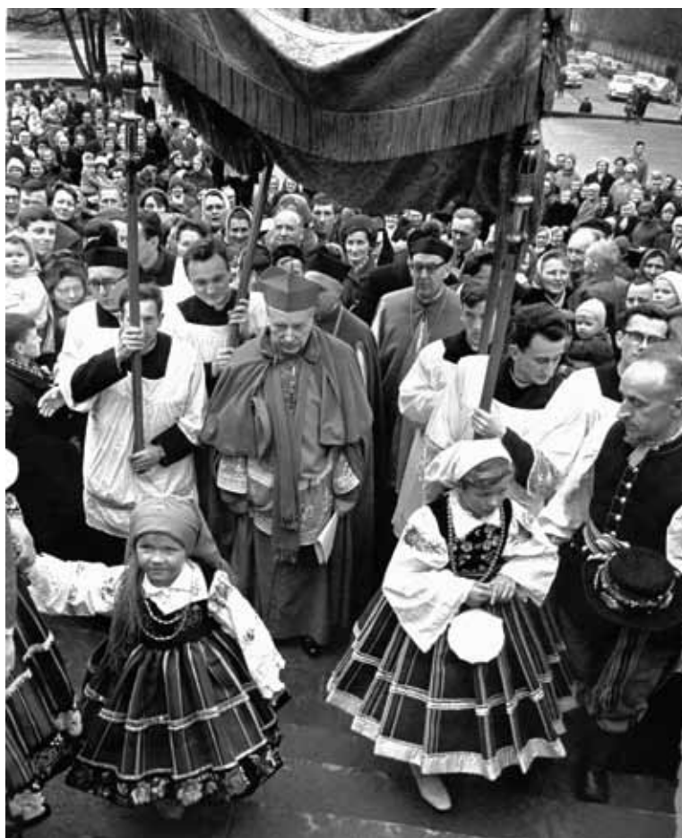
Obchody Tysiąclecia Chrztu Polski w Gnieźnie. Prymas Polski ks. kard. Stefan Wyszyński (pod baldachimem) w otoczeniu duchownych i dzieci w strojach ludowych przed schodami Bazyliki Prymasowskiej. Gniezno, 14 kwietnia 1966 r.