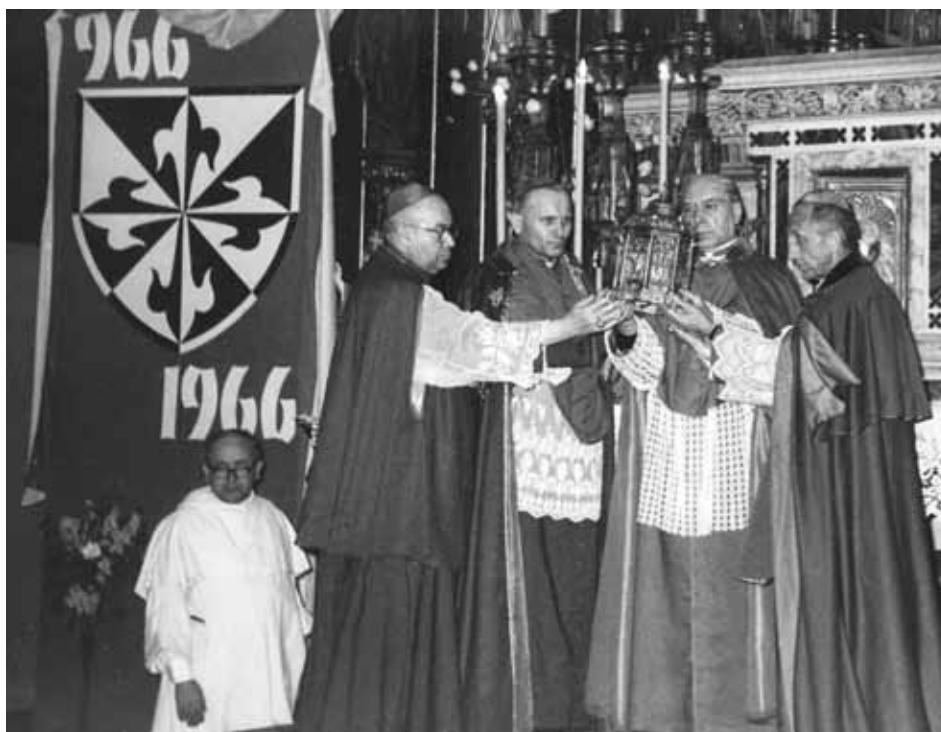
Obchody Tysiąclecia Chrztu Polski w Krakowie. II sesja naukowa w Bazylice oo. dominikanów. Błogosławieństwo relikwią głowy św. Jacka. Widoczni (od prawej): metropolita poznański ks. arcybiskup Antoni Baraniak, prymas Polski ks. kard. Stefan Wyszyński, metropolita krakowski ks. arcybiskup Karol Wojtyła i administrator apostolski diecezji wrocławskiej ks. arcybiskup Bolesław Kominek. Kraków, 7 maja 1966 r.