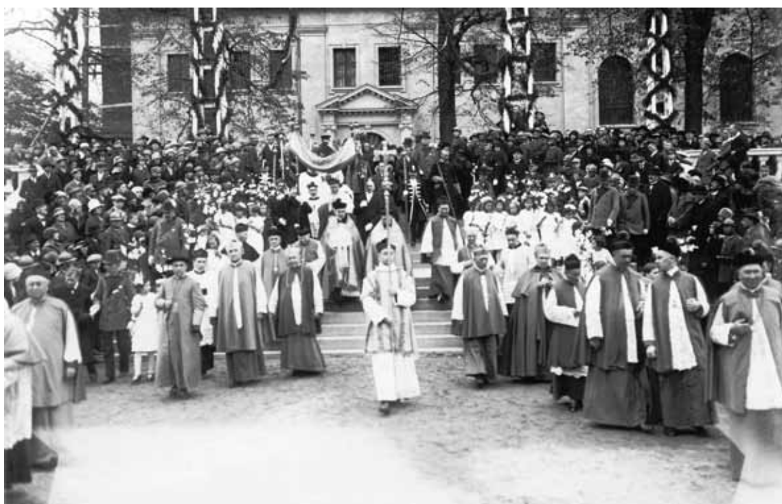
Ingres arcybiskupa Augusta Hlonda, metropolity gnieźnieńskiego, prymasa Polski. Prymas w otoczeniu episkopatu i kapituły przechodzi w uroczystej procesji z katedry do pałacu arcybiskupiego. Gniezno, październik 1926 r.