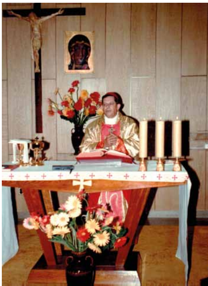
Kard. Józef Glemp w Sekretariacie Konferencji Episkopatu Polski.