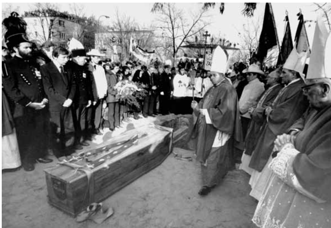
Trumna z ciałem zamordowanego ks. Jerzego Popiełuszki, skrapiana wodą święconą przez prymasa Józefa Glempa na placu przy kościele św. Stanisława Kostki na Żoliborzu. Warszawa, 3 listopada 1984 r.