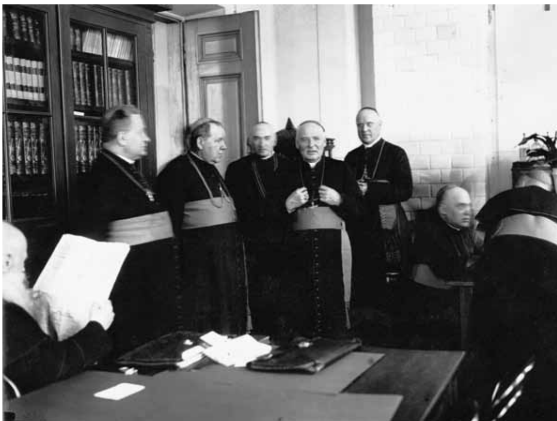
Zjazd Episkopatu Polski w Warszawie. Widoczni: (stoją od prawej) arcybiskup metropolita warszawski Aleksander Kakowski, biskup włocławski Stanisław Zdzitowiecki, arcybiskup metropolita lwowski obrządku ormiańskiego Józef Teodorowicz, biskup polowy Wojska Polskiego Stanisław Gall, biskup lubelski Marian Fulman oraz arcybiskup metropolita mohylewski Edward Ropp (czyta gazetę) i biskup podlaski Henryk Przeździecki (siedzi bokiem). Warszawa, maj 1925 r.