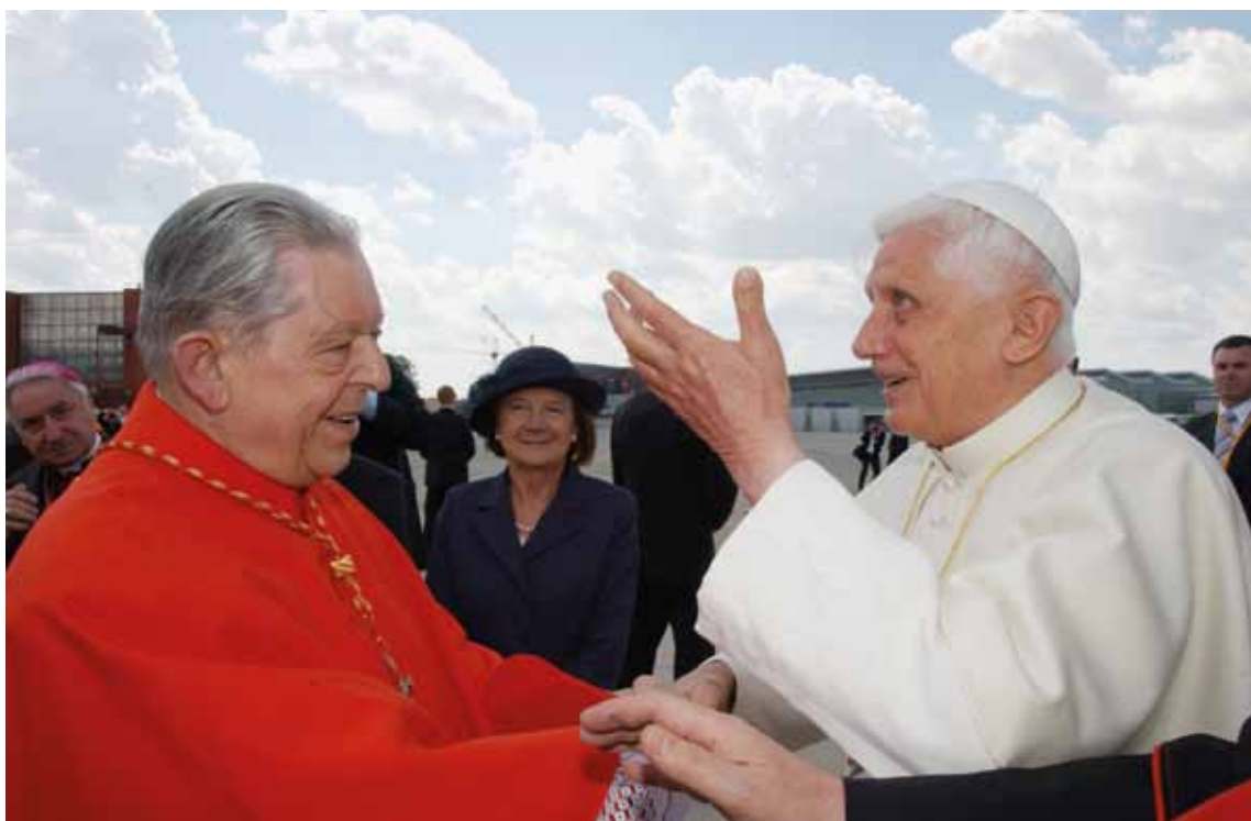
Wizyta Ojca Świętego Benedykta XVI w Polsce. Powitanie papieża z kard. Józefem Glempem. Warszawa, 25 maja 2006 r.