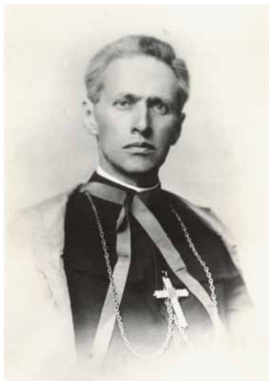
Bp Zygmunt Łoziński, biskup miński, a następnie biskup piński.