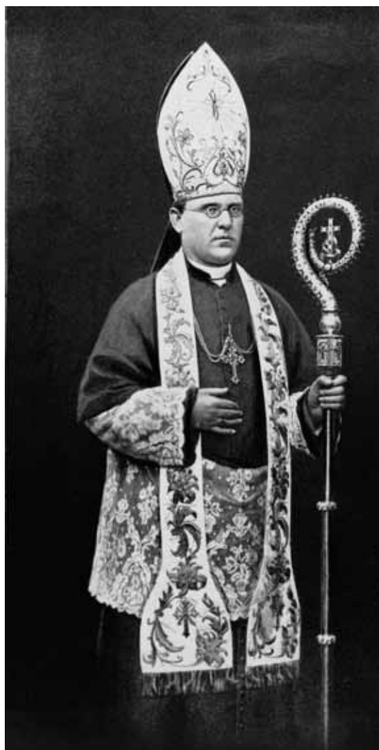
Kard. Aleksander Kakowski, arcybiskup metropolita warszawski. Warszawa 1925 r.