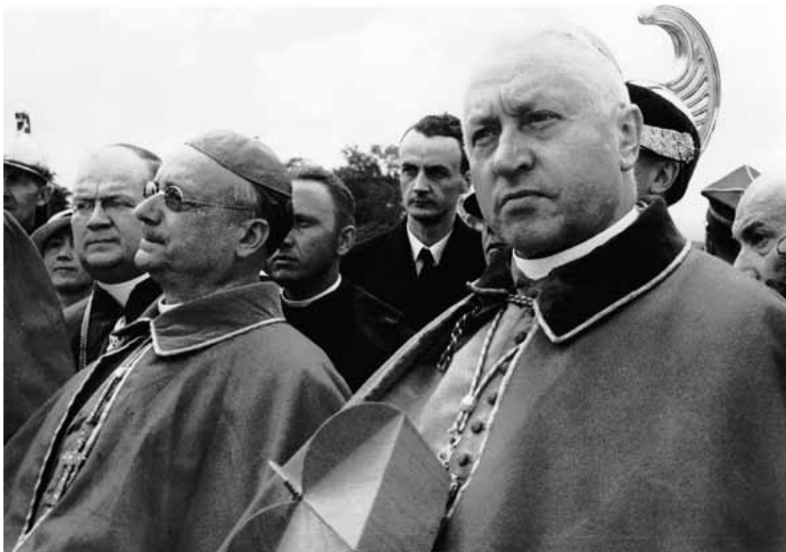
Plenarny Synod Biskupów Polskich na Jasnej Górze. Prymas Polski kard. August Hlond (z prawej) i legat papieski kard. Francesco Marmaggi (z lewej). Częstochowa, sierpień 1936 r.