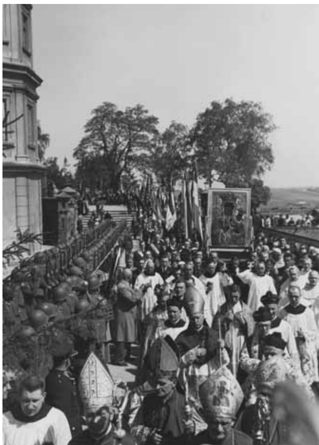
Zjazd młodzieży akademickiej na Jasnej Górze. Fragment procesji na wałach jasnogórskich z udziałem duchowieństwa, delegacji korporacji studenckich. Widoczni m.in.: Biskup Polowy WP Józef Gawlina, biskup pomocniczy warszawski Antoni Szlągowski, biskup tarnowski Franciszek Lisowski, prymas Polski kard. August Hlond. Częstochowa, maj 1936 r.