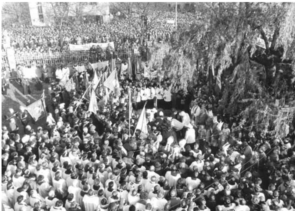
Uroczystości pogrzebowe ks. Jerzego Popiełuszki. Warszawa, 3 listopada 1984 r.