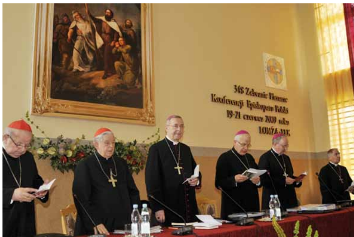
348. Zebranie Plenarne Konferencji Episkopatu Polski. Początek obrad. Widoczni na zdjęciu: kardynał Stanisław Dziwisz, kardynał Józef Glemp, arcybiskup Stanisław Gądecki, Wiceprzewodniczący Konferencji Episkopatu Polski, arcybiskup Józef Michalik, Przewodniczący Konferencji Episkopatu Polski, biskup Stanisław Budzik, Sekretarz Generalny, arcybiskup Józef Kowalczyk, Nuncjusz Apostolski w Polsce. Łomża–Elk, 19-21 czerwca 2009 r.