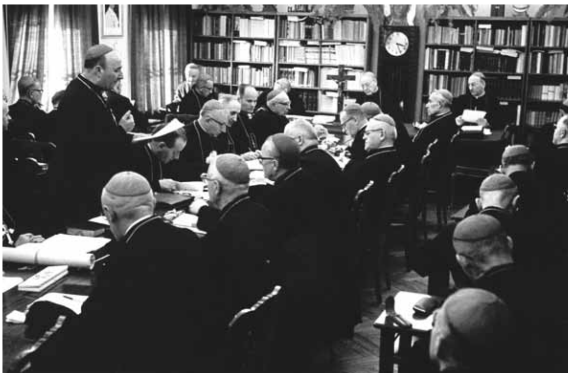
Zebranie Plenarne Konferencji Episkopatu Polski. Obrady w bibliotece Domu Arcybiskupów Warszawskich przy ul. Miodowej.