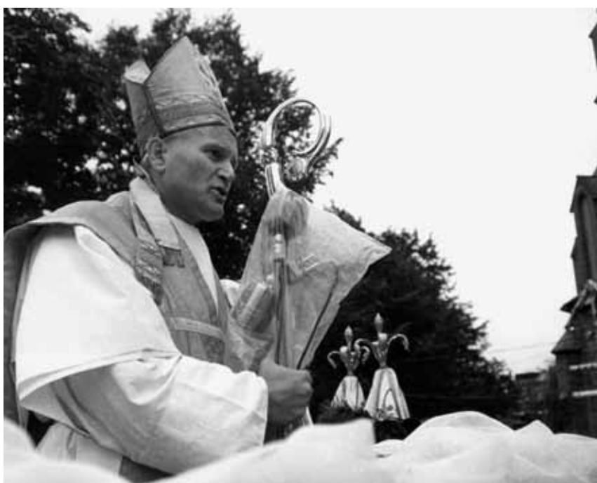
Obchody Tysiąclecia Chrztu Polski w Siedlcach. Metropolita krakowski abp Karol Wojtyła przemawia po zakończeniu Mszy Świętej. Siedlce, 18 września 1966 r.