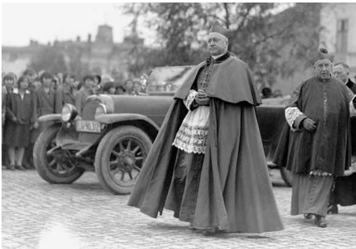
Jubileusz 25-lecia kapłaństwa kard. Augusta Hlonda, prymasa Polski. Powitanie prymasa Hlonda (na pierwszym planie w pelerynie) i biskupa przemyskiego Anatola Nowaka przez duchowieństwo i mieszkańców miasta. Poznań, wrzesień 1930 r.