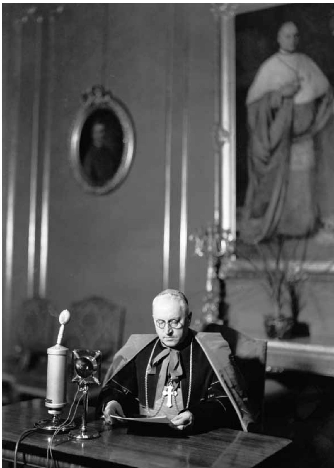
Przemówienie radiowe prymasa Polski kard. Augusta Hlonda z okazji świąt Bożego Narodzenia. Prymas August Hlond przed mikrofonem w sali Pałacu Biskupiego na Ostrowiu Tumskim. Poznań, 24 grudnia 1924 r.