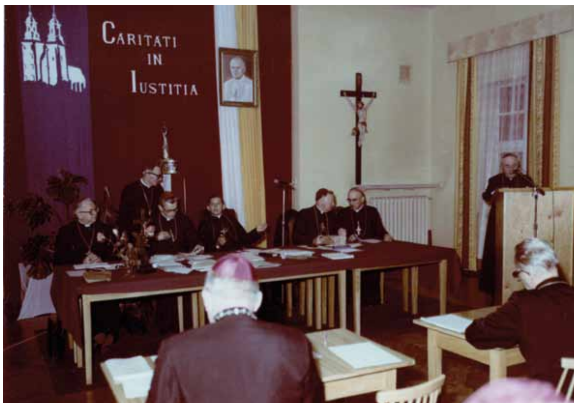
180. Konferencja Plenarna Episkopatu Polski. Gniezno, 14 września 1981 r.