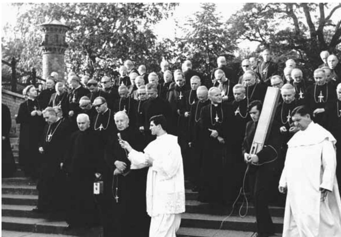
Rekolekcje Episkopatu Polski na Jasnej Górze. Różańcowi na wałach jasnogórskich przewodniczy kard. Stefan Wyszyński. Częstochowa, 1-4 września 1971 r.