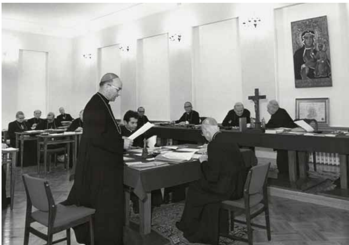
Konferencja Plenarna Episkopatu Polski. Biskupi podczas obrad. Warszawa, 13-14 września 1973 r.