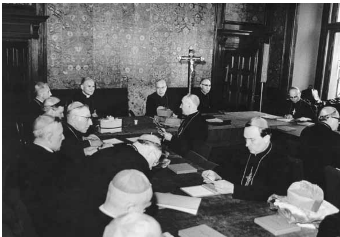
131. Zebranie Plenarne Konferencji Episkopatu Polski. W prezydium: kard. Karol Wojtyła, kard. Stefan Wyszyński, kard. Bolesław Kominek. Kraków, 27-28 czerwca 1972 r.