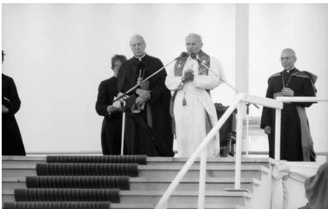
Papież Jan Paweł II przemawia podczas spotkania z wiernymi w Gębarzewie pod Gnieznem podczas pierwszej pielgrzymki do Polski. Obok papieża widoczni: prymas Polski, kard. Stefan Wyszyński, abp Agostino Casaroli. Gębarzewo pod Gnieznem, 3 czerwca 1979 r.