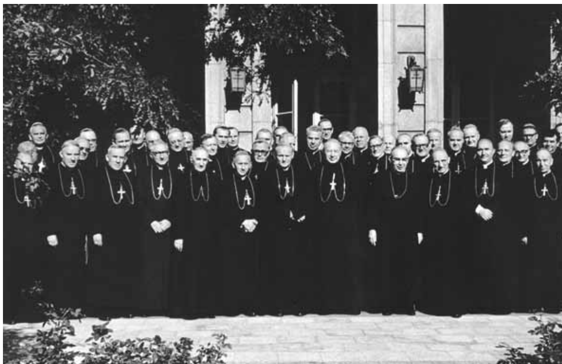
Zebranie Plenarne Konferencji Episkopatu Polski. Biskupi na tarasie Domu Arcybiskupów Warszawskich podczas przerwy w obradach. Warszawa, 13-14 września 1973 r.