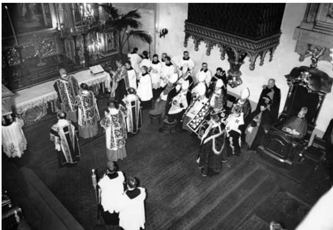
Pogrzeb kard. Aleksandra Kakowskiego w Warszawie. Widok z góry na prezbiterium archikatedry św. Jana Chrzciciela. Kard. August Hlond (stoi tyłem przy ołtarzu), nuncjusz apostolski abp. Filippo Cortesi (siedzi w stali), charge d'affaires Nuncjatury Apostolskiej w Polsce ks. prałat Arturo Pacini (siedzi na lewo od nuncjusza), abp. Stanisław Gall (siedzi trzeci z prawej w pierwszym rzędzie). Warszawa, 3-4 stycznia 1939 r.