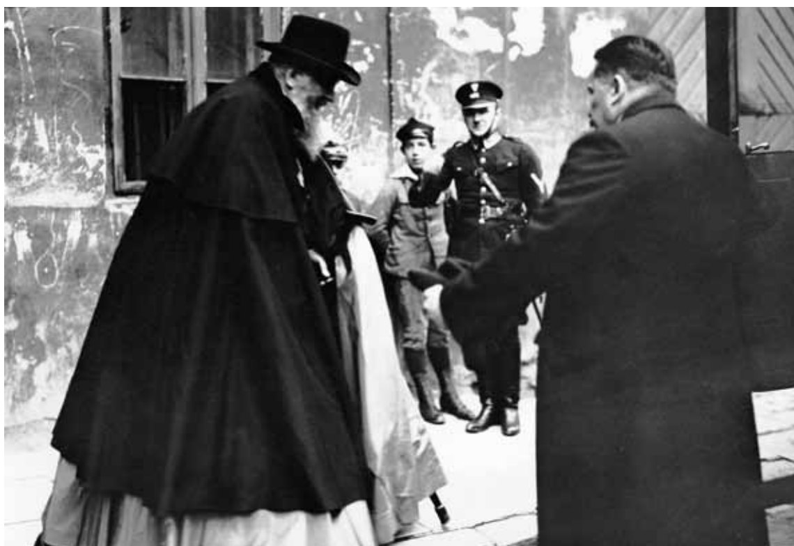
Zaprzysiężenie Episkopatu Polski na wierność Rzeczypospolitej. Arcybiskup lwowski obrządku greckokatolickiego Andrzej Szeptycki w drodze do Belwederu. Warszawa, wrzesień 1925 r.