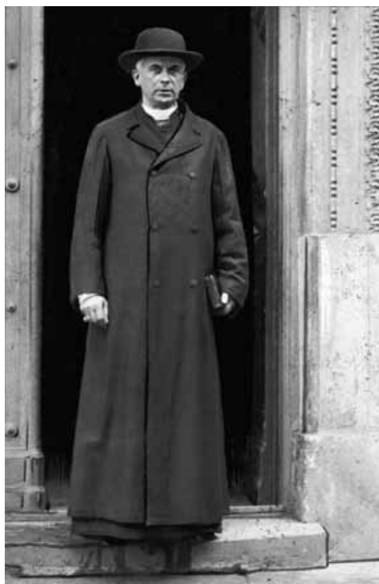
Kard. Edmund Dalbor, prymas Polski.