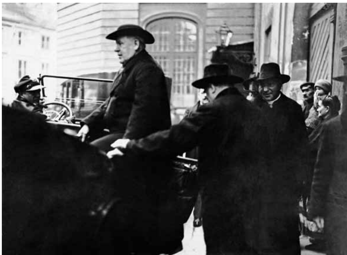
Zaprzysiężenie Episkopatu Polski na wierność Rzeczypospolitej. Biskup polowy WP Stanisław Gall wsiada do samochodu przed katedrą św. Jana. Warszawa, wrzesień 1925 r.