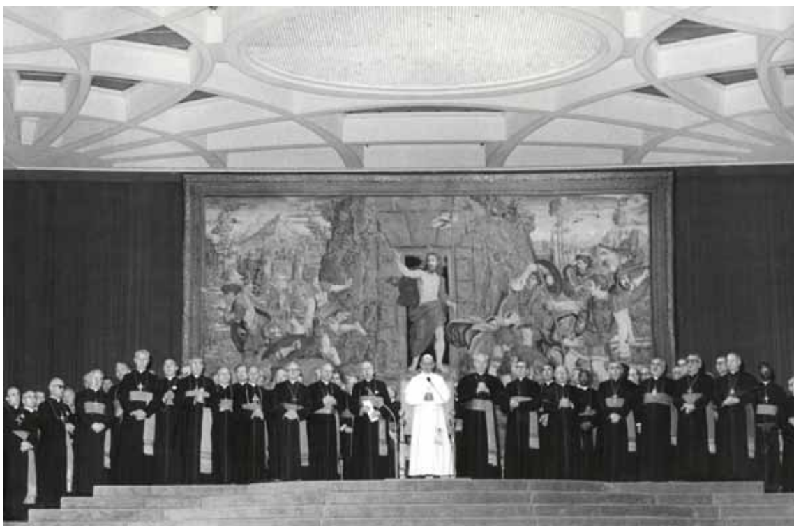
Audiencja u Ojca Świętego Pawła VI. W audyencji udział wzięli: kard. Stefan Wyszyński, kard. Karol Wojtyła, 20 polskich biskupów i ponad 2 tys. księży i świeckich katolików z 28 polskich diecezji. Rzym, 11 października 1975 r.