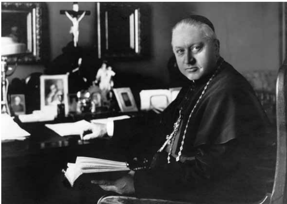
Kard. August Hlond, arcybiskup metropolita gnieźnieński, prymas Polski przy pracy w swoim gabinecie w mieszkaniu na Ostrowiu Tumskim. Poznań, 1932 r.