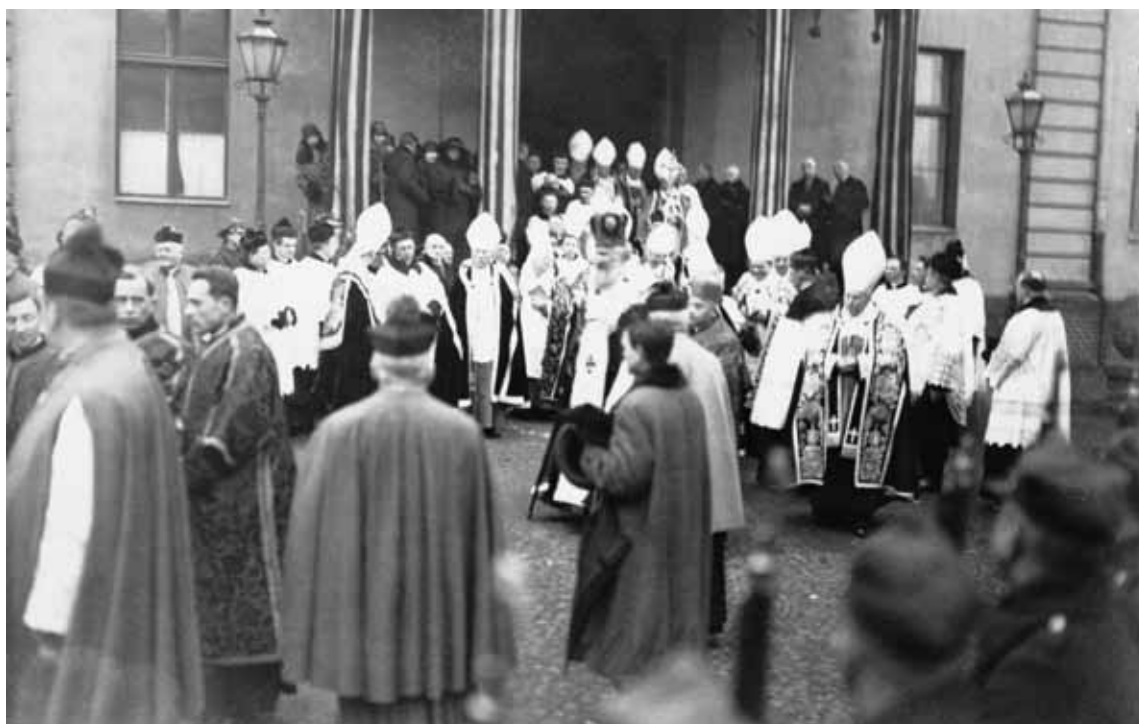
Pogrzeb prymasa Polski ks. kard. Edmunda Dalbora. Biskupi uczestniczący w pogrzebie wychodzą procesyjnie z Pałacu Arcybiskupiego. Widoczny m.in. arcybiskup metropolita lwowski obrządku greckokatolickiego Andrzej Szeptycki. Poznań, luty 1926 r.