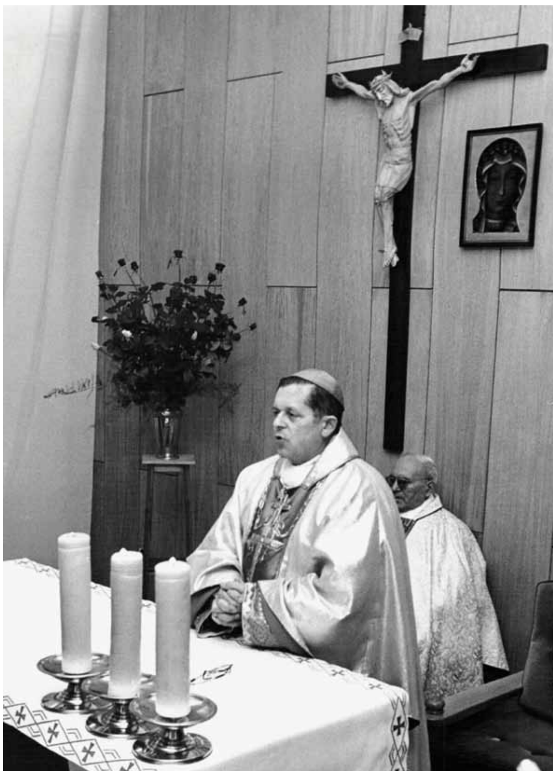
Kard. Józef Glemp w kaplicy w Sekretariacie Konferencji Episkopatu Polski.