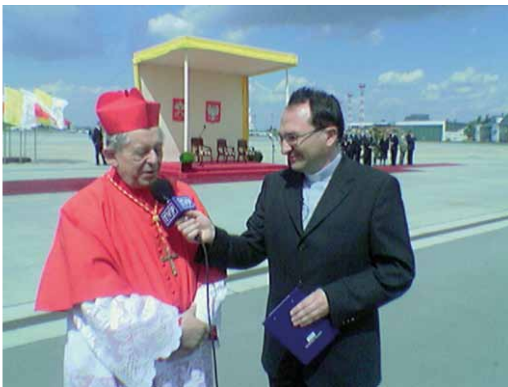
Wizyta Ojca Świętego Benedykta XVI w Polsce. Kard. Józef Glemp z ks. Andrzejem Majewskim w oczekiwaniu na przylot papieża. Warszawa, 25 maja 2006 r.