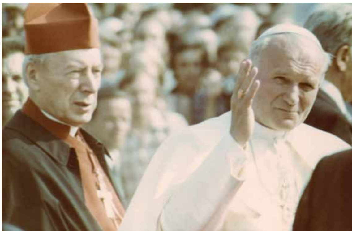
Papież Jan Paweł II z kard. Stefanem Wyszyńskim podczas pierwszej pielgrzymki do Polski. 2 czerwca 1979 r.