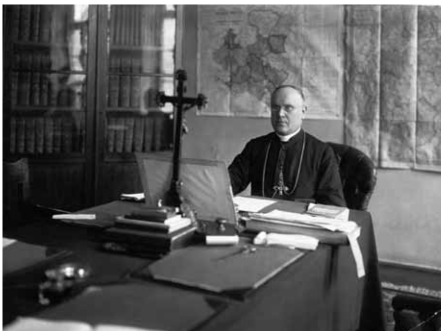
Kard. Aleksander Kakowski, arcybiskup metropolita warszawski. Warszawa 1925 r.