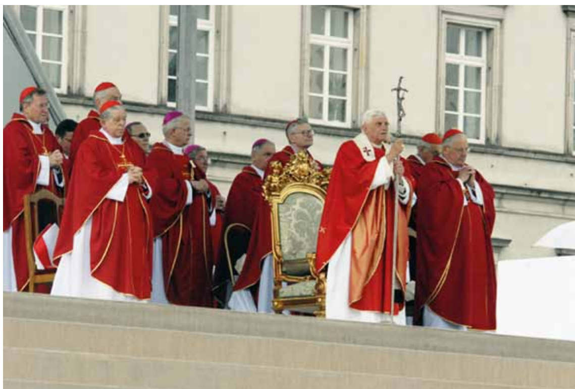
Wizyta Ojca Świętego Benedykta XVI w Polsce. Częstochowa, 26 maja 2006 r.