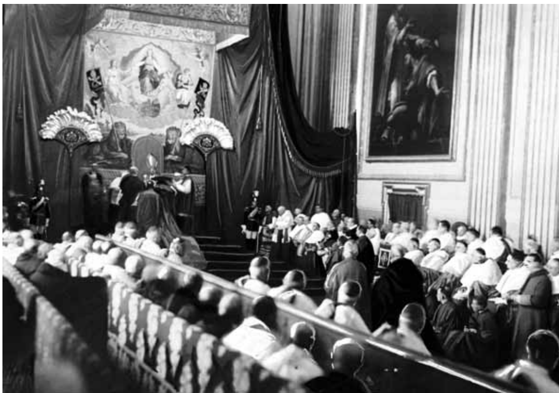
Uroczystość wręczenia kapelusza kardynalskiego abp. Augustowi Hlondowi, prymasowi Polski. Rzym, 1927–1928 r.