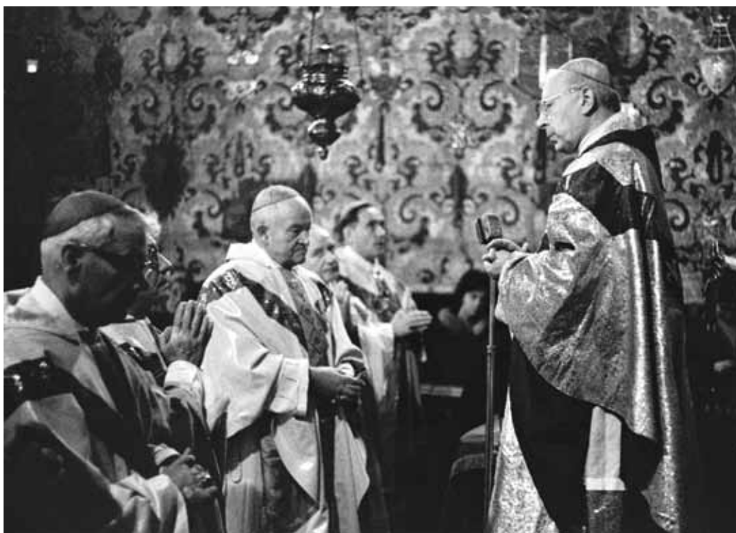
Rekolekcje Episkopatu Polski na Jasnej Górze. Mszy Świętej w Kaplicy Cudownego Obrazu Matki Bożej przewodniczy kard. Stefan Wyszyński. Częstochowa, 1-4 września 1971 r.