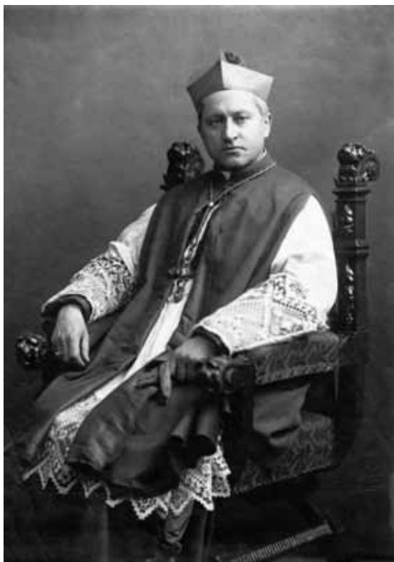
Kard. August Hlond, arcybiskup metropolita gnieźnieński, prymas Polski, 1932 r.