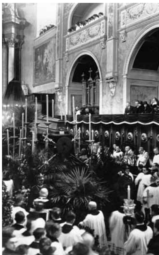
Pogrzeb prymasa Polski ks. kard. Edmunda Dalbora. Uroczystości pogrzebowe w katedrze poznańskiej. Poznań, luty 1926 r.