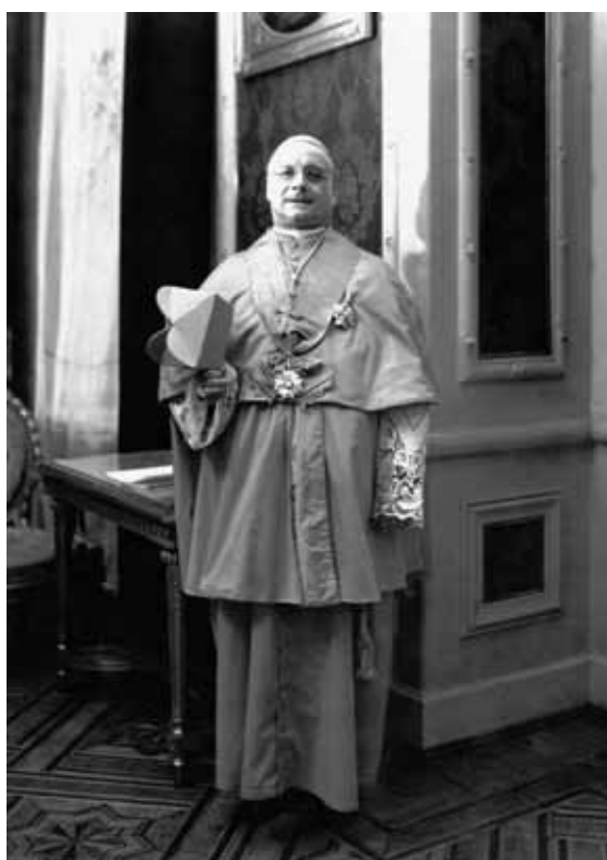
Świętowanie nadania godności kardynała nuncjuszowi apostolskiemu w Polsce arcybiskupowi Francesco Marmaggiemu. Warszawa, 28 grudnia 1935 lub 4 stycznia 1936 r.