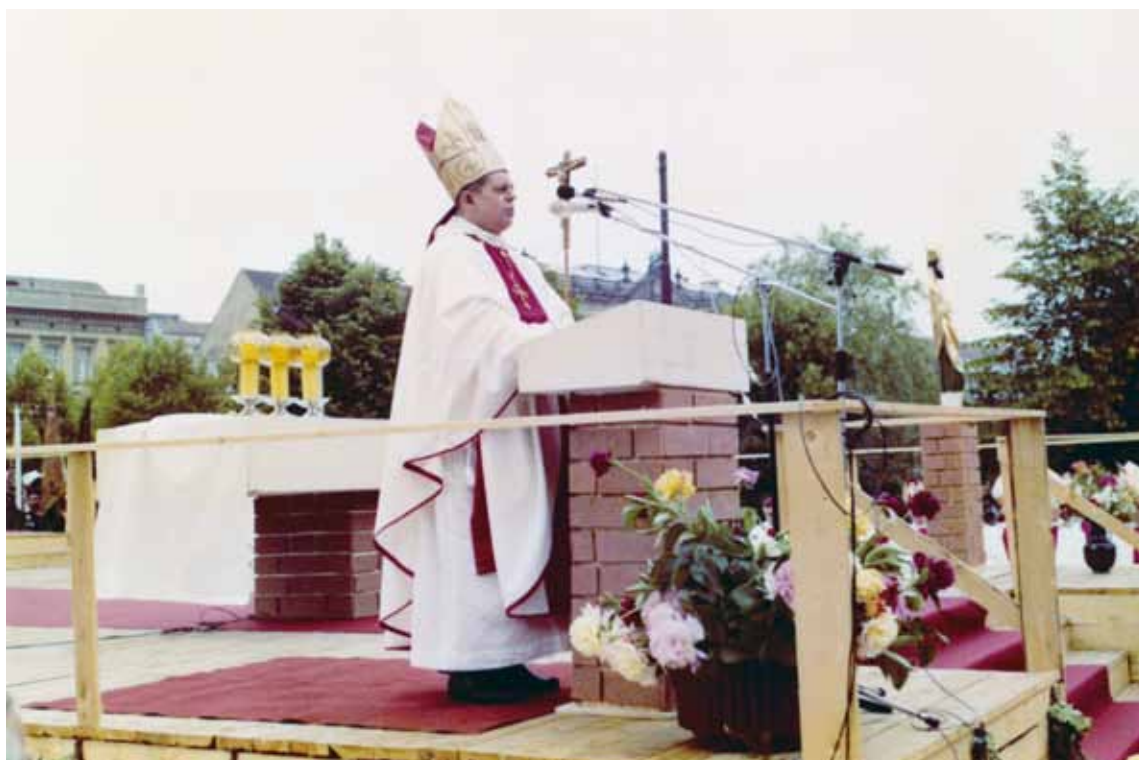
Uroczystości 40-lecia powrotu Ziemi Zachodnich do macierzy. Prymas Polski kard. Józef Glemp głosi homilię podczas uroczystej Mszy Świętej. Szczecin, 22-23 czerwca 1985 r.