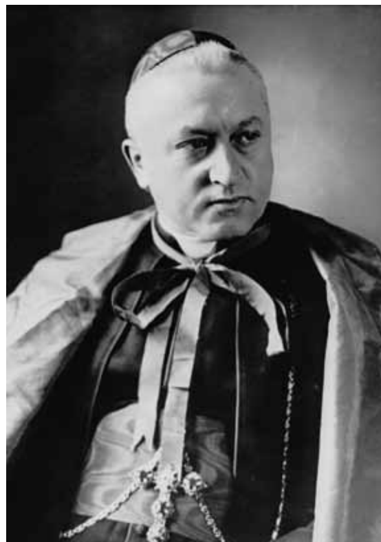
Kard. August Hlond, arcybiskup metropolita gnieźnieński, kardynał, prymas Polski, 1936 r.