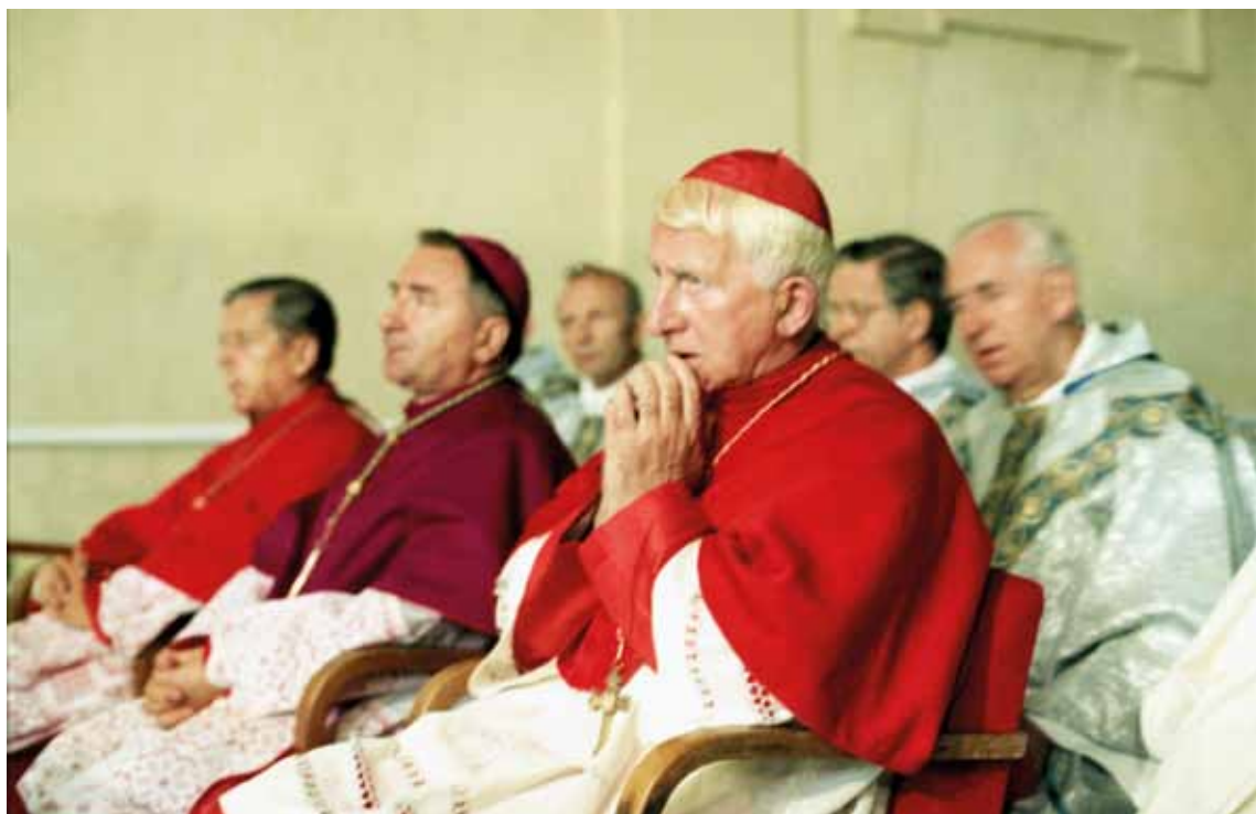
Uroczystość z udziałem członków Rady Konferencji Episkopatów Europejskich na Jasnej Górze. Widoczni (od lewej): prymas Polski kard. Józef Glemp, członek Zespołu do Spraw Stałych Kontaktów Roboczych Między Rządem PRL i Stolicą Apostolską ks. Józef Kowalczyk, przewodniczący Rady Konferencji Episkopatów Europejskich kard. George Basil Hume. Częstochowa, październik 1986 r.