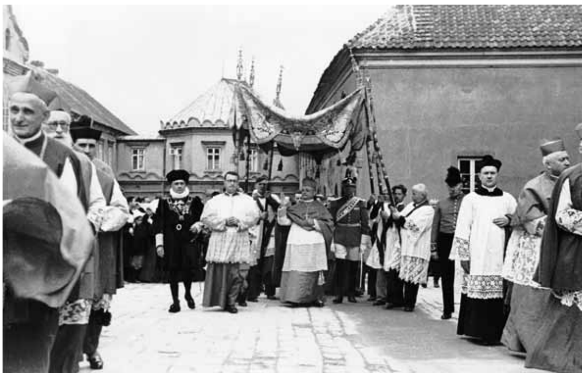
Plenarny Synod Biskupów Polskich na Jasnej Górze. Legat papieski kard. Francesco Marmaggi pod baldachimem w procesji z klasztoru do bazyliki. Widoczni także m.in.: arcybiskup krakowski Adam Sapieha (pierwszy z lewej), metropolita mohylewski arcybiskup Edward Ropp (drugi z lewej), charge d'affaires Nuncjatury Apostolskiej w Polsce ks. prałat Alfredo Pacini (trzeci z lewej), Prymas Polski kard. August Hlond (drugi z prawej). Częstochowa, sierpień 1936 r.