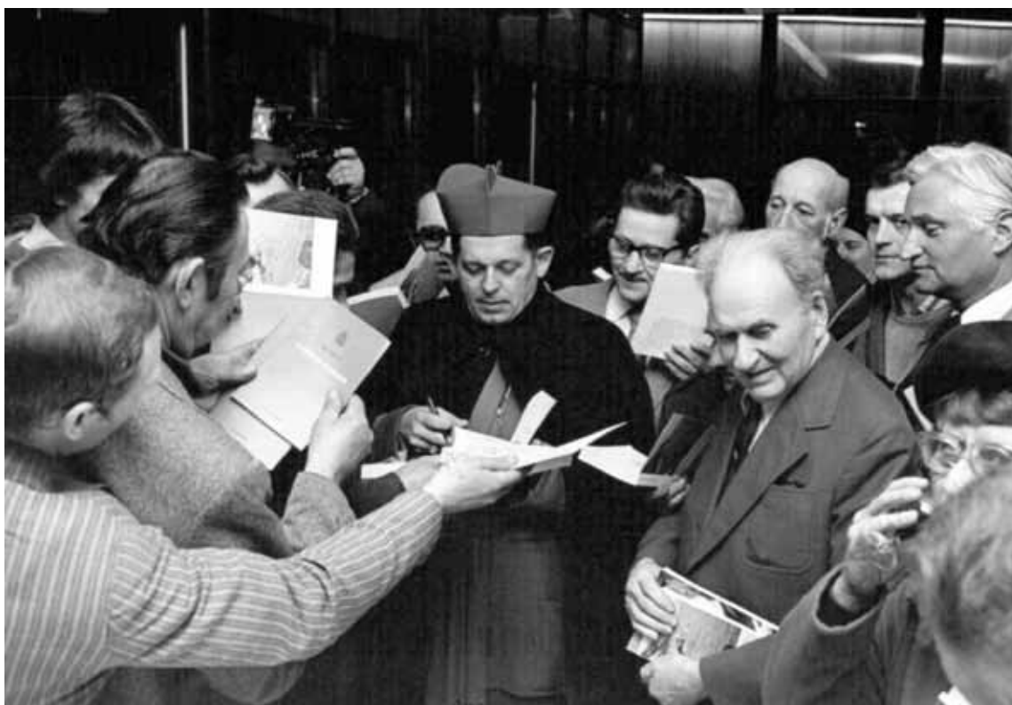
Kard. Józef Glemp w Sekretariacie Konferencji Episkopatu Polski.