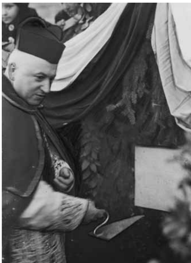
Uroczystość poświęcenia kamienia węgielnego pod budowę Seminarium Zagranicznego w Poznaniu z udziałem kard. Augusta Hlonda. Poznań, 1936 r.