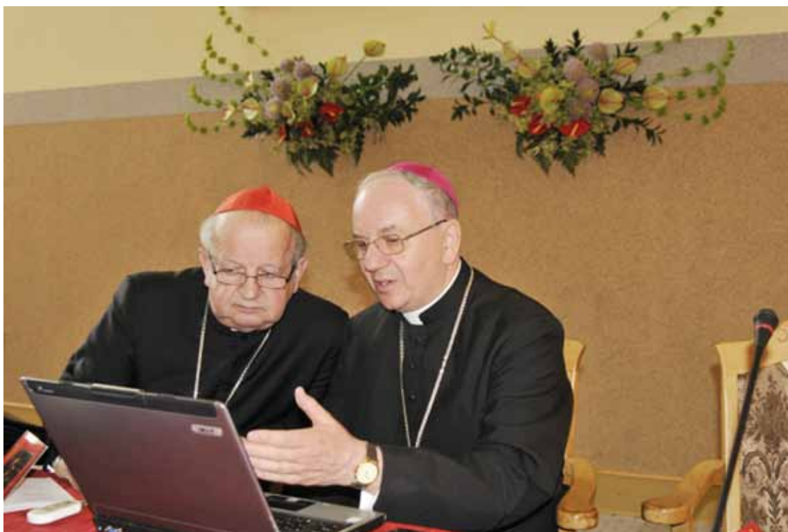
348. Zebranie Plenarne Konferencji Episkopatu Polski. Kardynał Stanisław Dziwisz i arcybiskup Stanisław Budzik, Sekretarz Generalny Konferencji Episkopatu Polski. Łomża–Elk, 19-21 czerwca 2009 r.