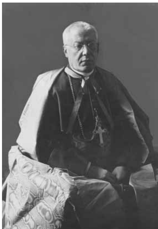
Bp Lorenzo Lauri, nuncjusz apostolski w Polsce. Warszawa 1926 r.