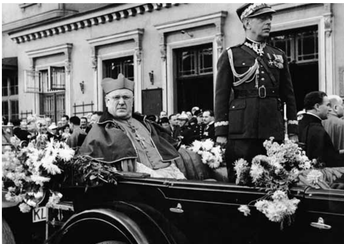
Plenarny Synod Biskupów Polskich na Jasnej Górze. Powitanie metropolity warszawskiego kard. Aleksandra Kakowskiego (pierwszy z lewej) na dworcu. Widoczny także gen. bryg. Janusz Gąsiorowski (stoi w samochodzie obok kardynała). Częstochowa, sierpień 1936 r.