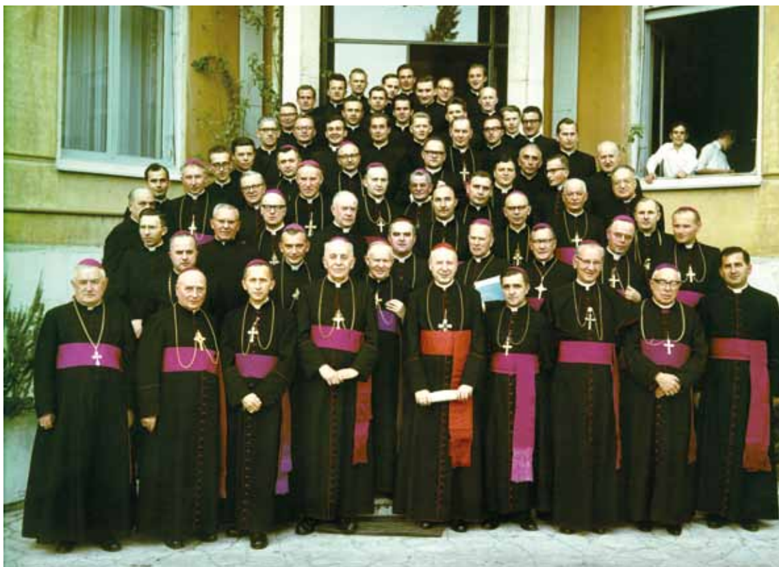
Kard. Stefan Wyszyński z Episkopatem Polskim w Rzymie.