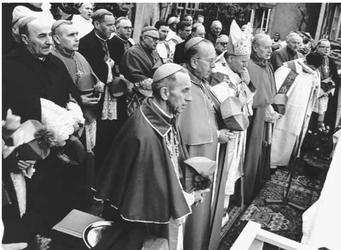
Uroczystość Matki Bożej Królowej Polski na Jasnej Górze. Episkopat Polski podczas uroczystości. Na pierwszym planie (stoją od lewej): bp Antoni Baraniak, kard. Franz König, kard. Karol Wojtyła i kard. Stefan Wyszyński.