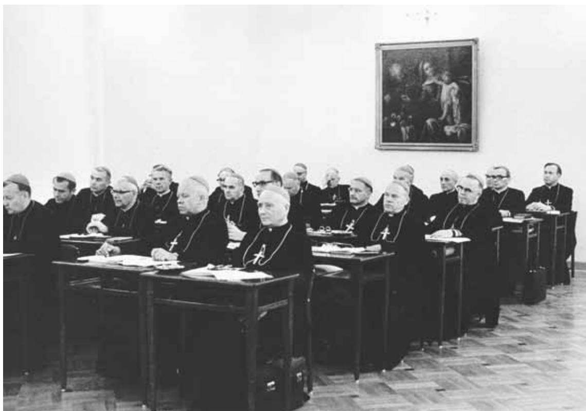
Konferencja Plenarna Episkopatu Polski. Biskupi podczas obrad. Warszawa, 13-14 września 1973 r.