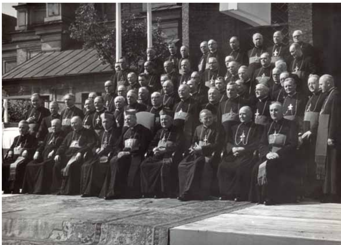
Episkopat – podczas uroczystości 20-lecia polskiej administracji kościelnej na Ziemiach Zachodnich. Na zdjęciu widoczni m.in.: kard. Stefan Wyszyński (siedzi piąty z prawej), abp Karol Wojtyła (siedzi trzeci z prawej). Wrocław, 22 sierpnia – 2 września 1965 r.