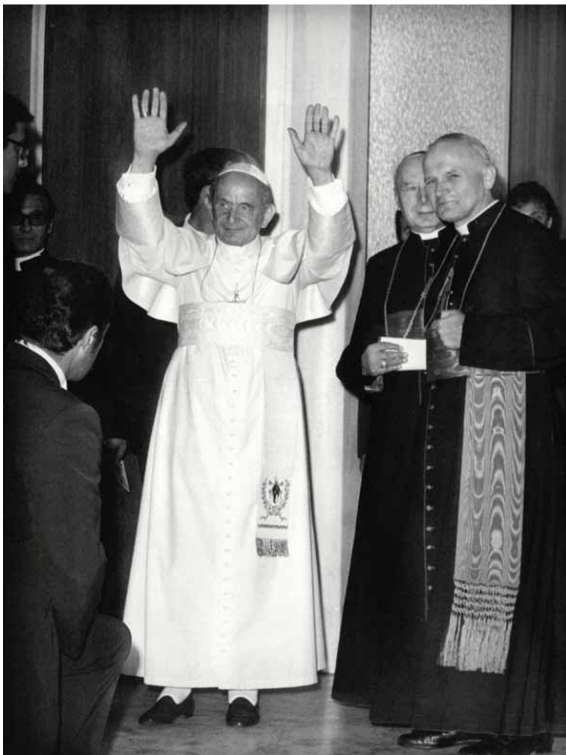
Podczas audiencji u Ojca Świętego Pawła VI. Poza kard. Stefanem Wyszyńskim i kard. Karolem Wojtyłą w spotkaniu uczestniczyło 20 polskich biskupów i ponad 2 tys. księży i świeckich z 28 polskich diecezji. Rzym, 11 października 1975 r.