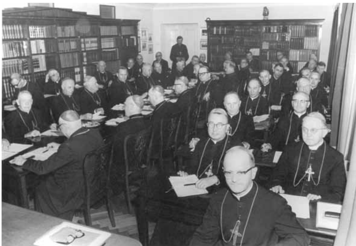
Zebranie Plenarne Konferencji Episkopatu. Warszawa, 12 września 1967 r.