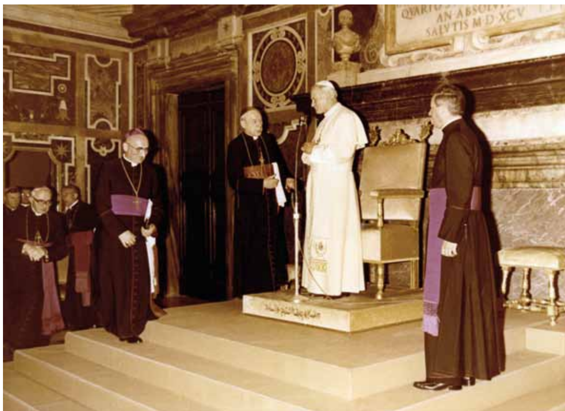
Kard. Stefan Wyszyński i Jan Paweł II. Rzym, wrzesień 1980 r.