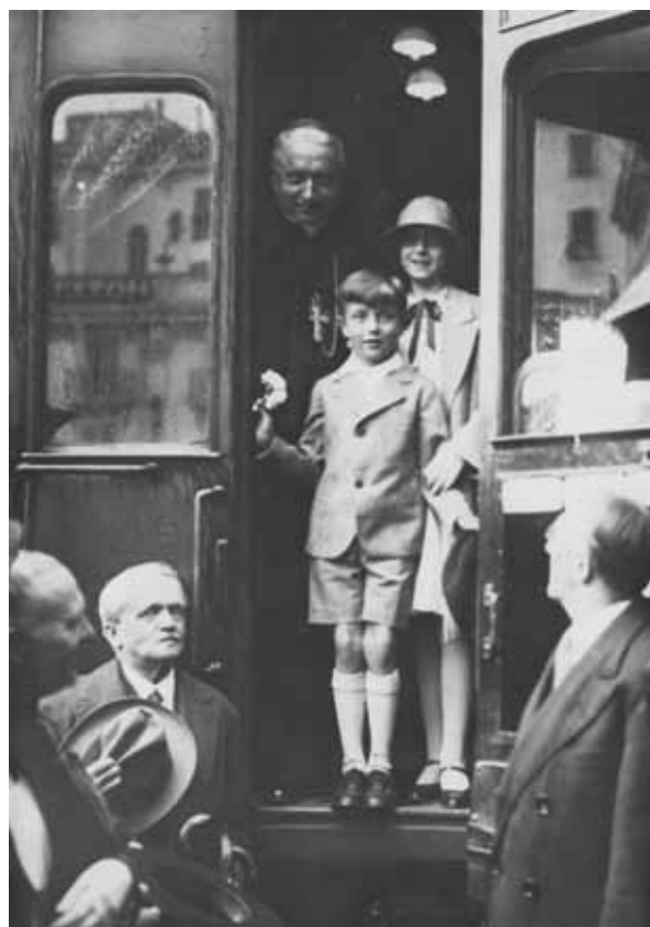
Wizyta kard. Augusta Hlonda we Włoszech. Prymas Polski w drzwiach pociągu, w towarzystwie dwójki dzieci. San Remo, Włochy, maj 1930 r.