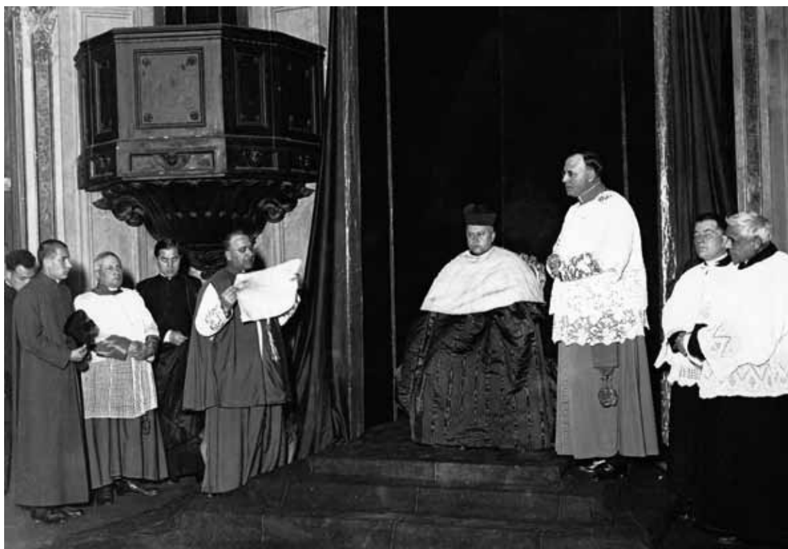
Prymas Polski ks. kard. August Hlond podczas uroczystości przyznania kościoła tytularnego. Rzym, 1927–1928 r.