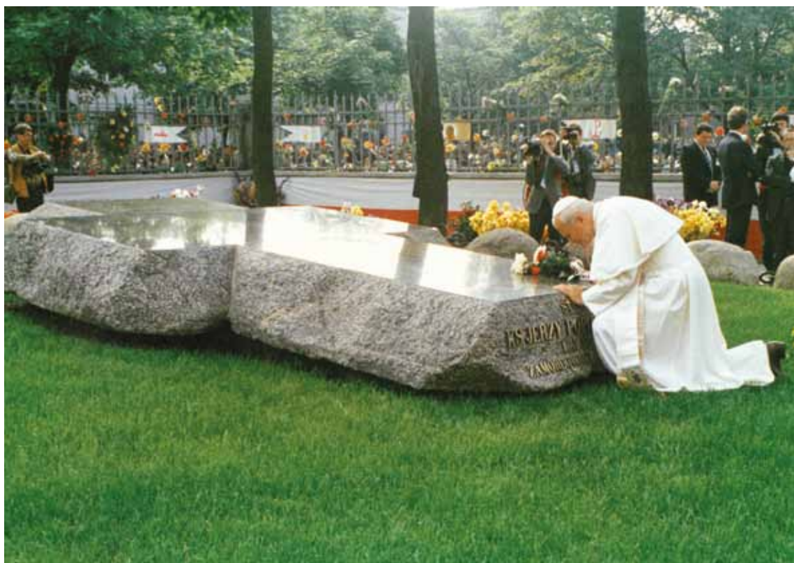
Papież Jan Paweł II przy grobie ks. Jerzego Popiełuszki podczas trzeciej pielgrzymki do Polski. Warszawa, 14 czerwca 1987 r.