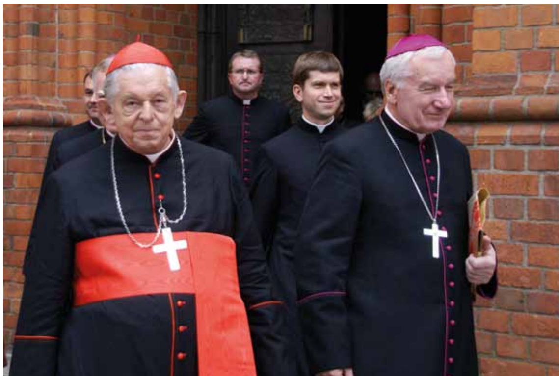
Kard. Józef Glemp. Włocławek 2011 r.