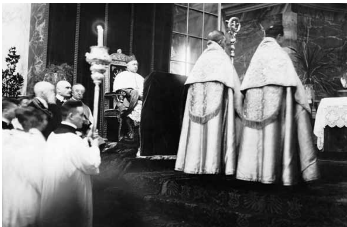
Ingres arcybiskupa Augusta Hlonda, metropolity gnieźnieńskiego, prymasa Polski. Prymas podczas uroczystego nabożeństwa w katedrze gnieźnieńskiej. Gniezno, październik 1926 r.