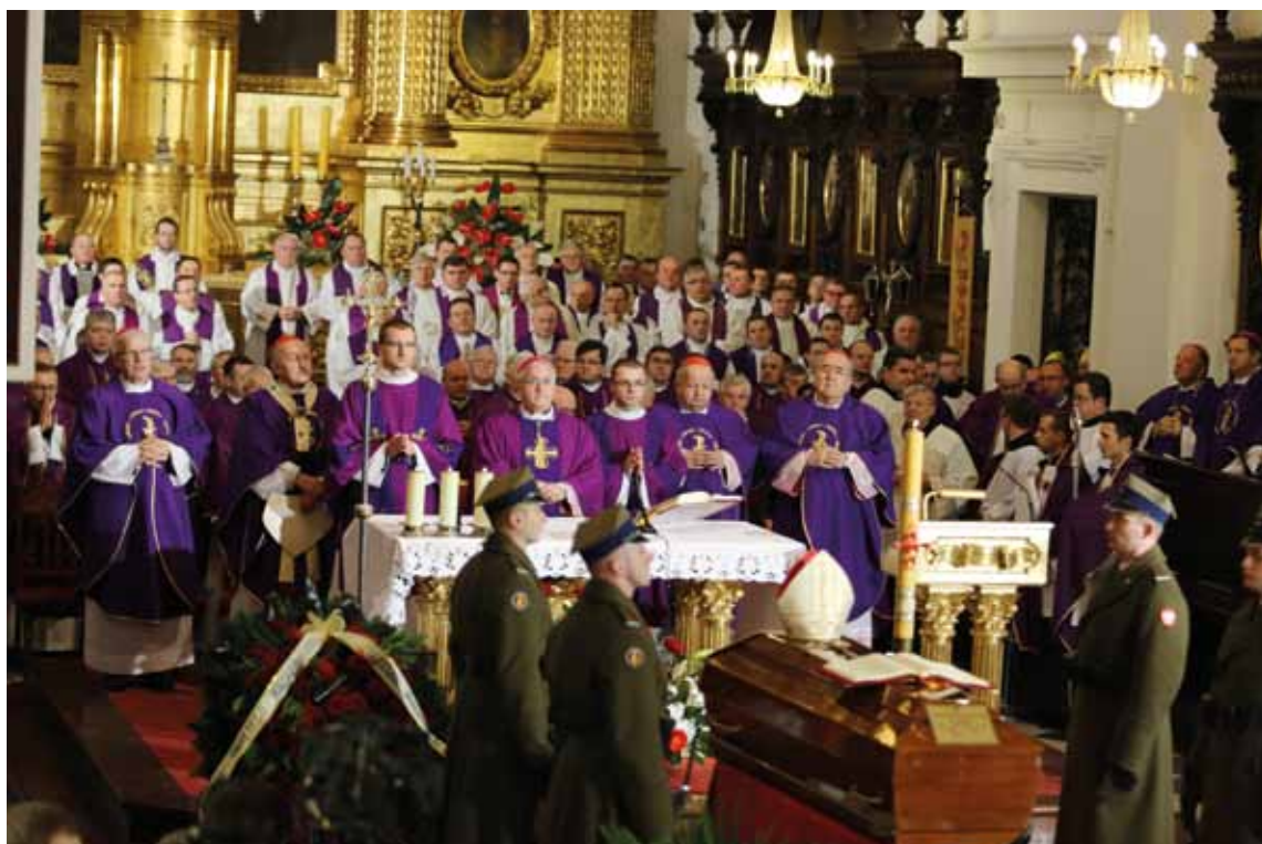
Pogrzeb kard. Józefa Glempa, prymasa Polski. Warszawa, 27 stycznia 2013 r.