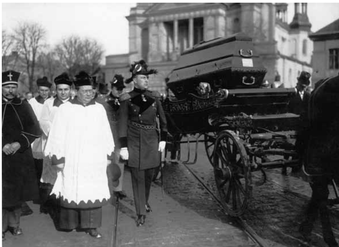
Pogrzeb prymasa Polski ks. kard. Edmunda Dalbora. Fragment konduktu na ulicach miasta. Widoczni kawalerowie maltańscy otaczający powóz z trumną. Poznań, luty 1926 r.