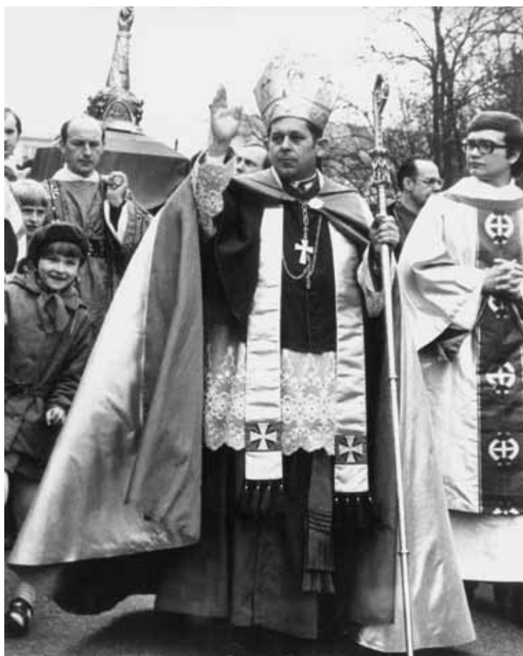
Kard. Józef Glemp, Prymas Polski.