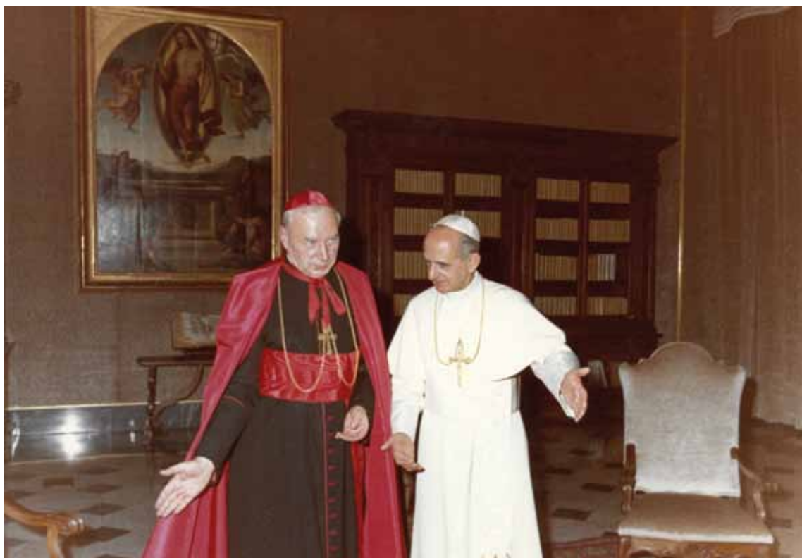
Spotkanie Ojca Świętego Pawła VI z kard. Stefanem Wyszyńskim. Rzym, 11 października 1975 r.