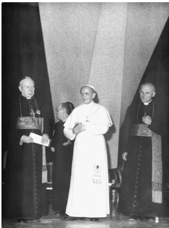
Audycja u Ojca Świętego Pawła VI. Prymas Polski kard. Stefan Wyszyński (z lewej) i kard. Karol Wojtyła. Rzym, 11 października 1975 r.