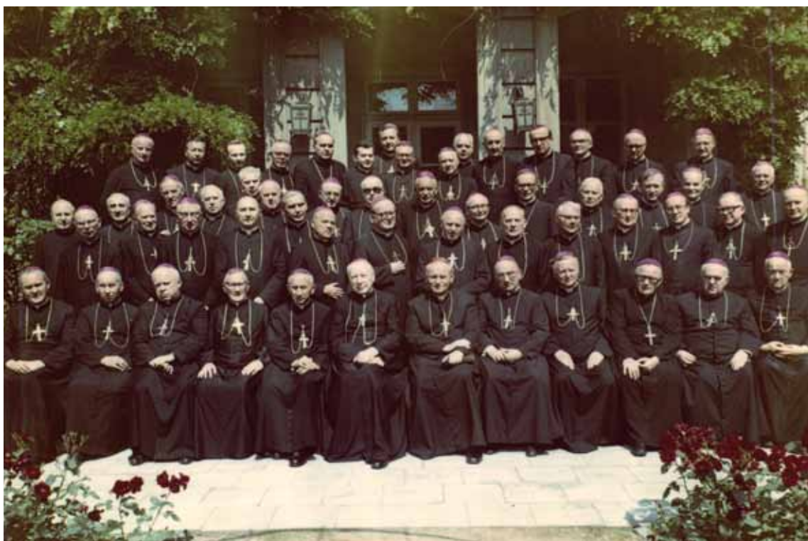
Wspólna fotografia w trakcie Zebrania Plenarnego Konferencji Episkopatu Polski. Ogród Domu Arcybiskupów Warszawskich przy ul. Miodowej.