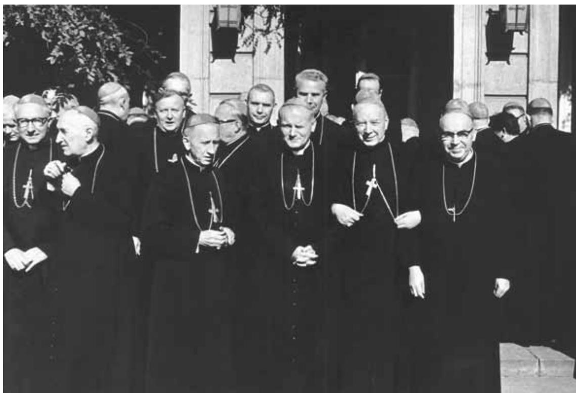
Konferencja Plenarna Episkopatu Polski. Biskupi na tarasie Domu Arcybiskupów Warszawskich podczas przerwy w obradach. Warszawa, 13-14 września 1973 r.