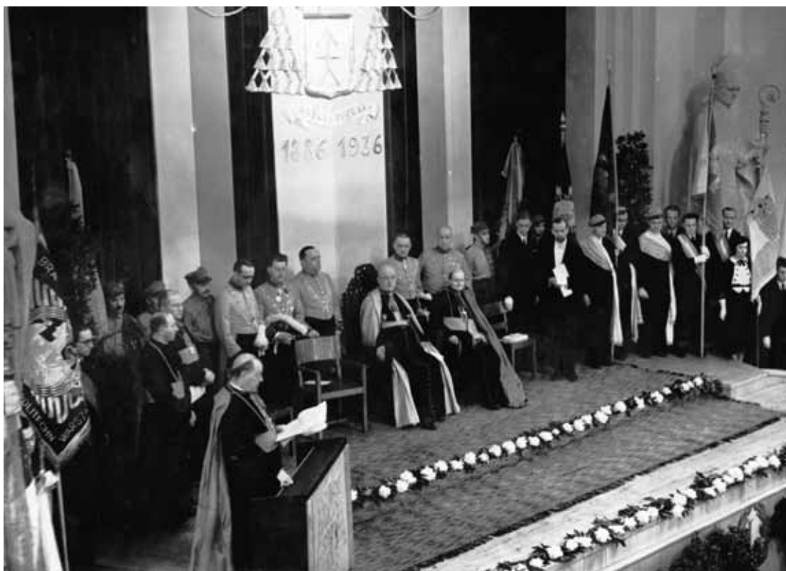
Akademia w Domu Katolickim z okazji jubileuszu 50-lecia kapłaństwa ks. kard. Aleksandra Kakowskiego, arcybiskupa metropolity warszawskiego. Warszawa, czerwiec 1936 r.