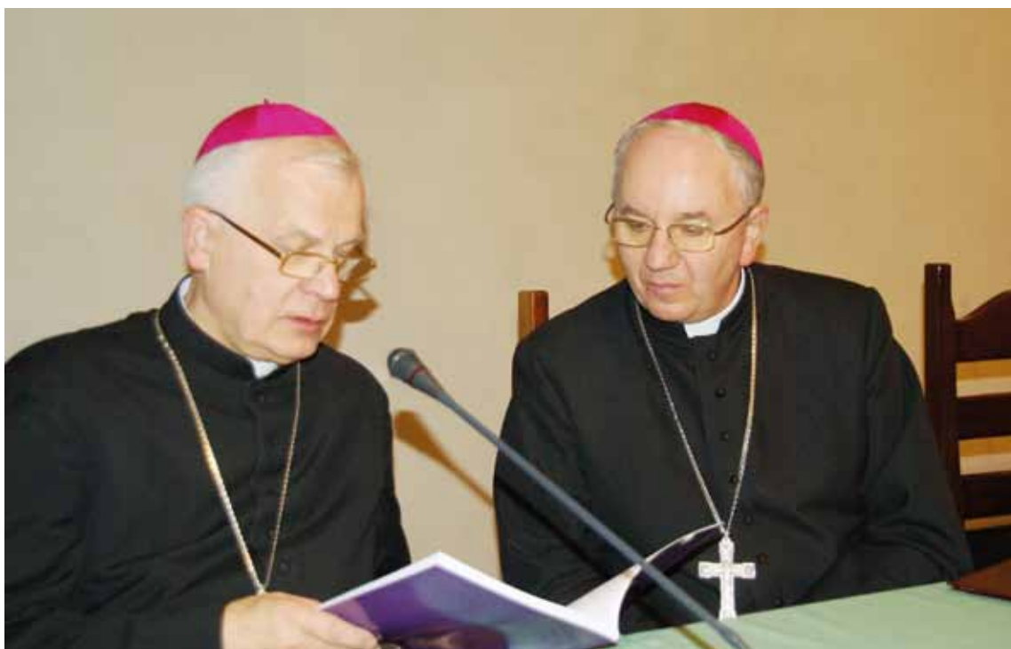
349. Zebranie Plenarne Konferencji Episkopatu Polski. Konferencja prasowa. Arcybiskup Józef Michalik, Przewodniczący Konferencji Episkopatu Polski (z lewej) oraz biskup Stanisław Budzik, Sekretarz Generalny Konferencji Episkopatu Polski. Warszawa, 7 października 2009 r.