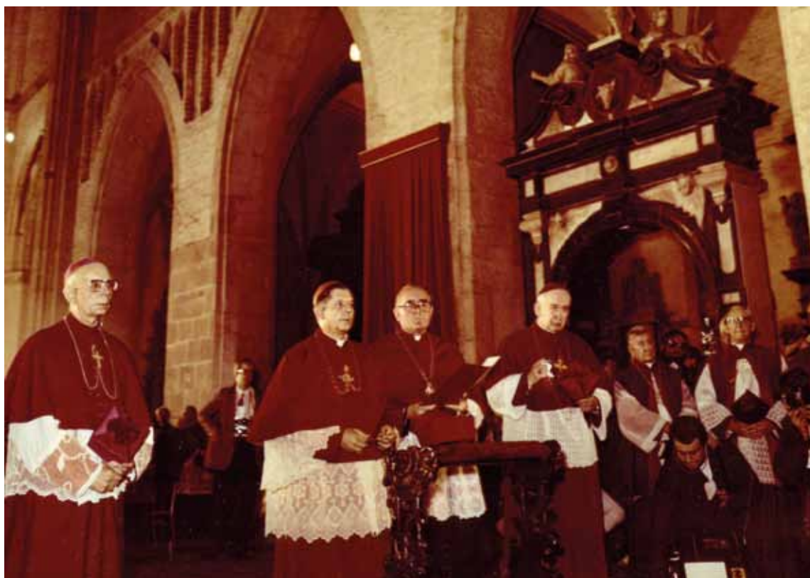
Ingres prymasa Józefa Glempa do archikatedry gnieźnieńskiej. Gniezno, 13 września 1981 r.