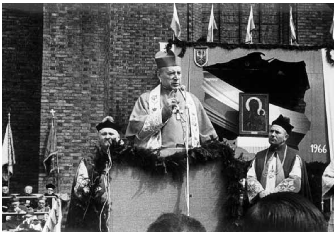
Obchody Tysiąclecia Chrztu Polski w Poznaniu. Prymas Polski ks. kard. Stefan Wyszyński wygłasza homilię podczas uroczystej sumy pontyfikalnej na placu przed katedrą. Poznań, 17 kwietnia 1966 r.