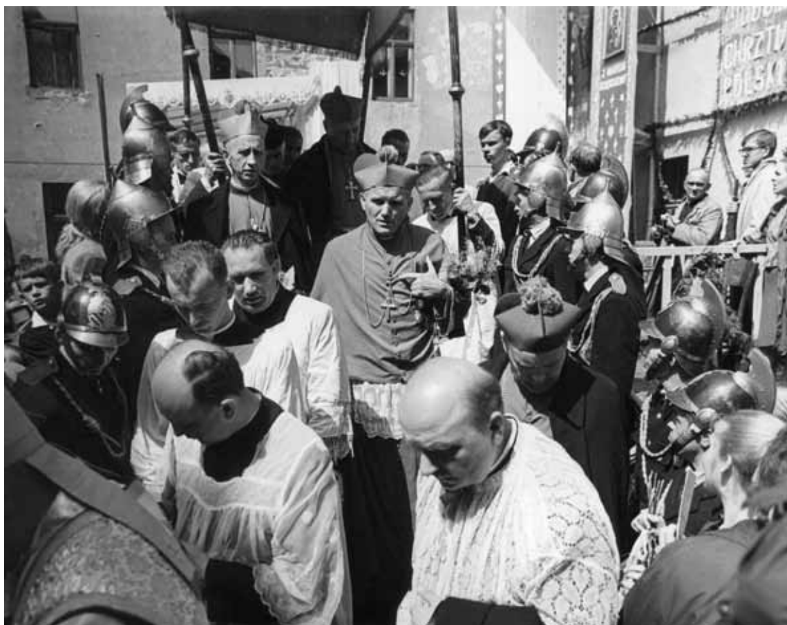
Obchody Tysiąclecia Chrztu Polski w Starym Sączu. Widoczni m.in. kard. Stefan Wyszyński, metropolita krakowski abp Karol Wojtyła, metropolita poznański abp Antoni Baraniak. Stary Sącz, 24 lipca 1966 r.