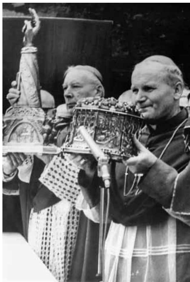
Obchody Tysiąclecia Chrztu Polski w Gnieźnie. Kard. Stefan Wyszyński z relikwiarzem św. Wojciecha, abp Karol Wojtyła z relikwiarzem św. Stanisława. Gniezno, 14 kwietnia 1966 r.