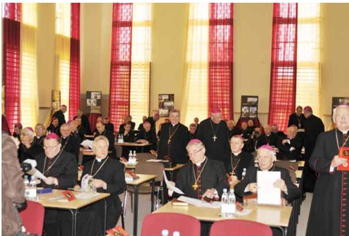
348. Zebranie Plenarne Konferencji Episkopatu Polski. Biskupi zgromadzeni na sali obrad. Łomża–Elk, 19-21 czerwca 2009 r.