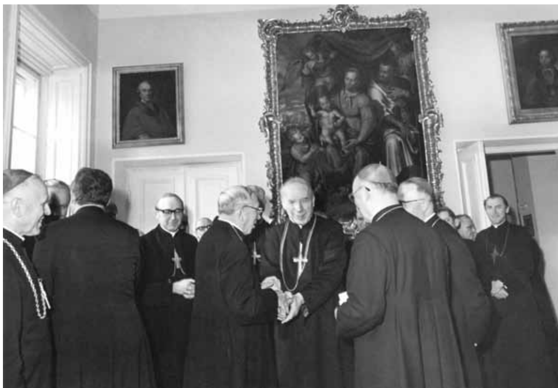
Zebranie Plenarne Konferencji Episkopatu w Warszawie. Warszawa, 22 marzec 1979 r.