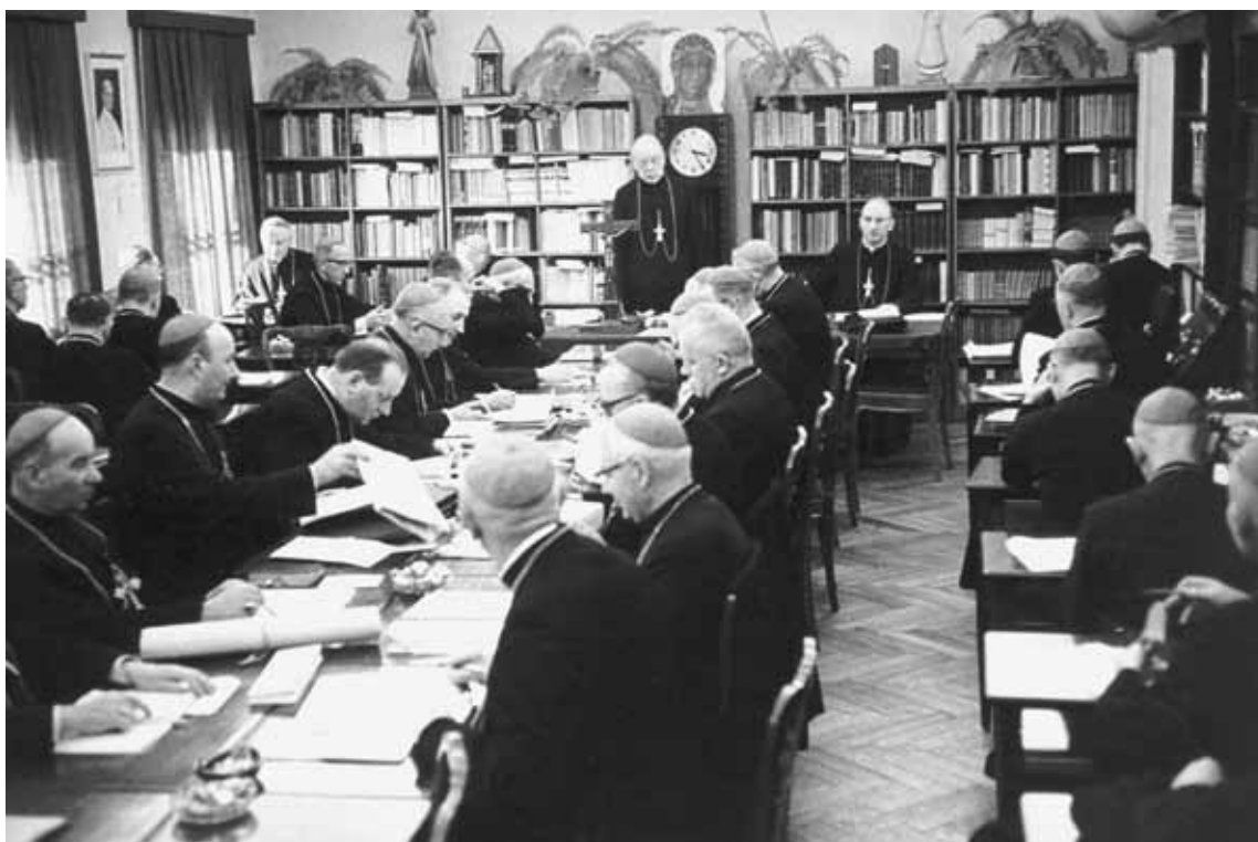
Kard. Stefan Wyszyński przewodniczy Zebraniu Plenarnemu Konferencji Episkopatu Polski w bibliotece Domu Arcybiskupów Warszawskich.