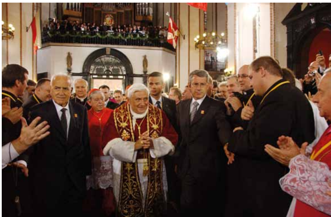
Wizyta Ojca Świętego Benedykta XVI w Polsce. Warszawa, 25 maja 2006 r.