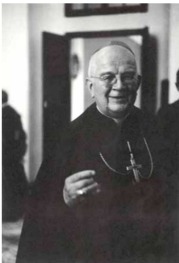
Bp Zygmunt Choromański, biskup pomocniczy warszawski w latach 1946–1968, sekretarz generalny Konferencji Episkopatu Polski w latach 1946–1968.