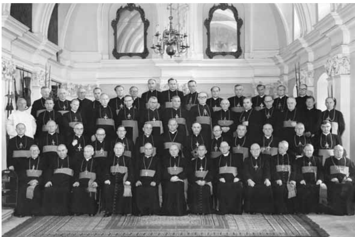
Zebrań Konferencji Episkopatu Polski na Jasnej Górze. Częstochowa, 2 września 1960 r.