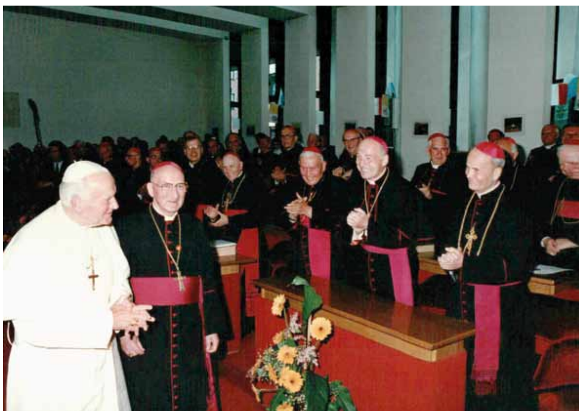
Trzecia pielgrzymka papieża Jana Pawła II do Polski. Wizyta w Sekretariacie Konferencji Episkopatu Polski (zdjęcia na obu stronach). Warszawa, 13 czerwca 1987 r.