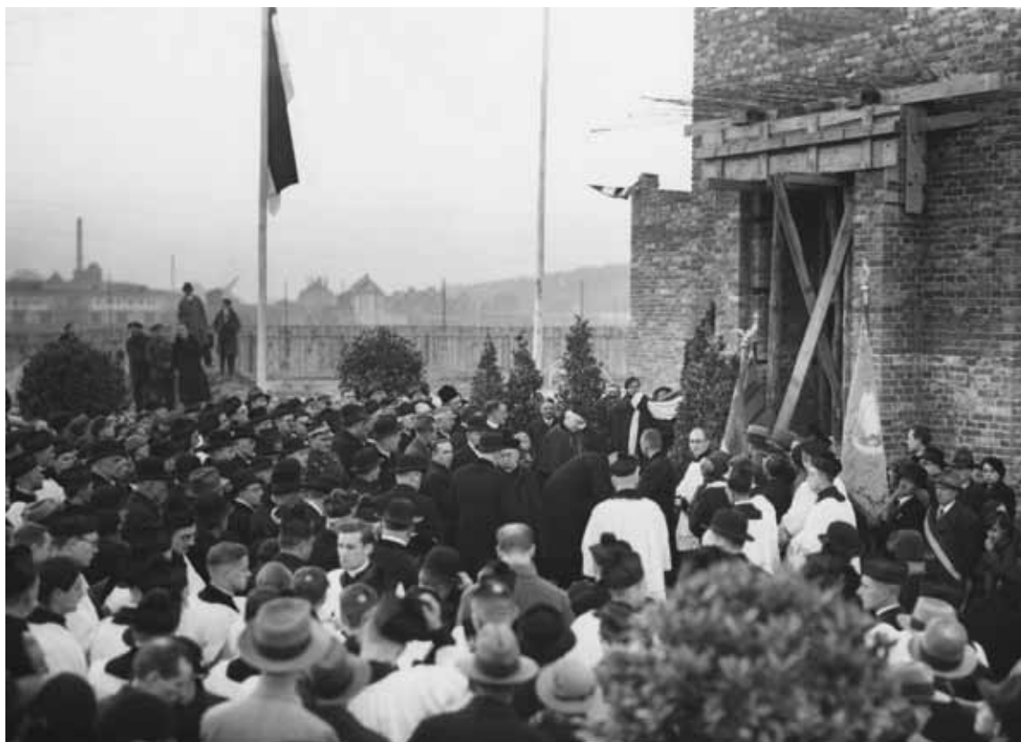
Uroczystość poświęcenia kamienia węgielnego pod budowę Seminarium Zagranicznego w Poznaniu. Poznań, 1936 r.