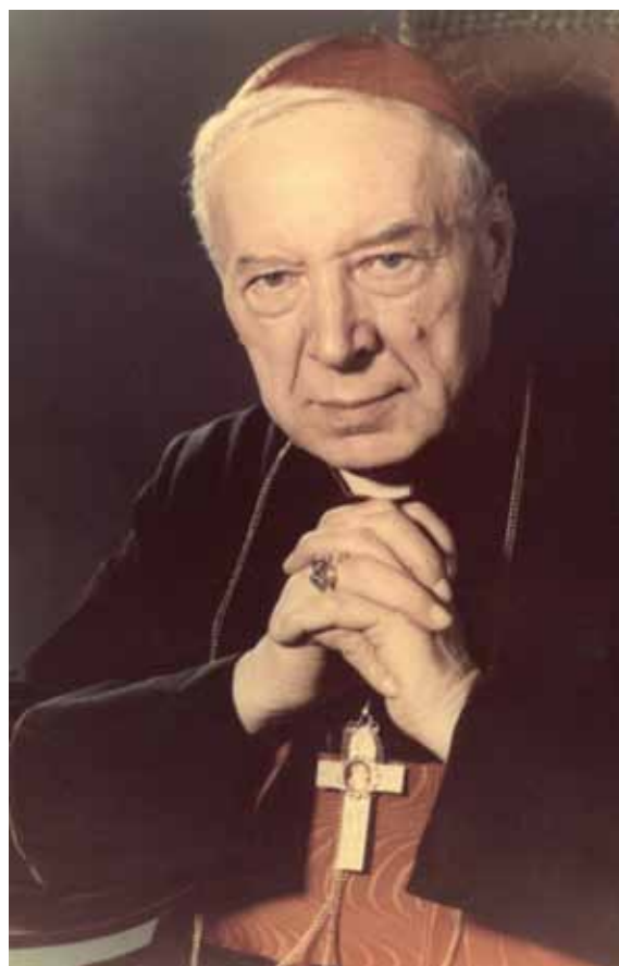
Kard. Stefan Wyszyński, prymas Polski.