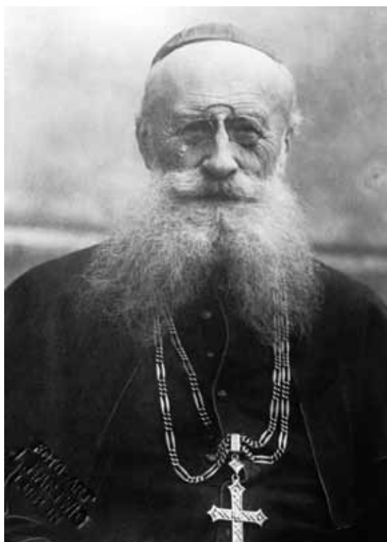
Abp Edward Ropp, metropolita mohylewski.