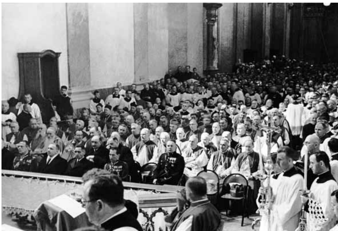
Plenarny Synod Biskupów Polskich na Jasnej Górze. Uczestnicy synodu podczas nabożeństwa. Częstochowa, sierpień 1936 r.