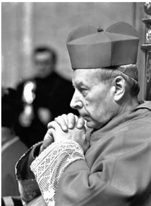
Kard. Stefan Wyszyński podczas obchodów Tysiąclecia Chrztu Polski w Gnieźnie. Gniezno, 14 kwietnia 1966 r.