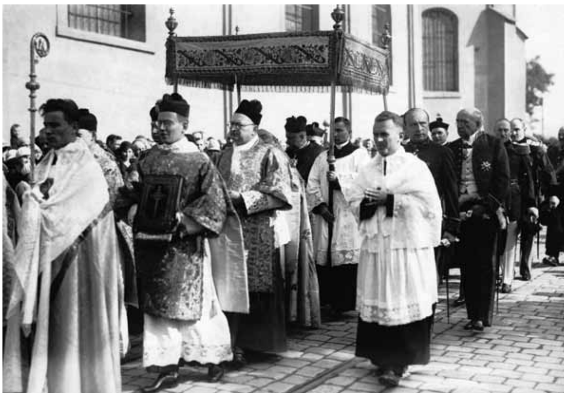
Jubileusz 25-lecia kapłaństwa kard. Augusta Hlonda, prymasa Polski. Fragment uroczystej procesji. Poznań, wrzesień 1930 r.