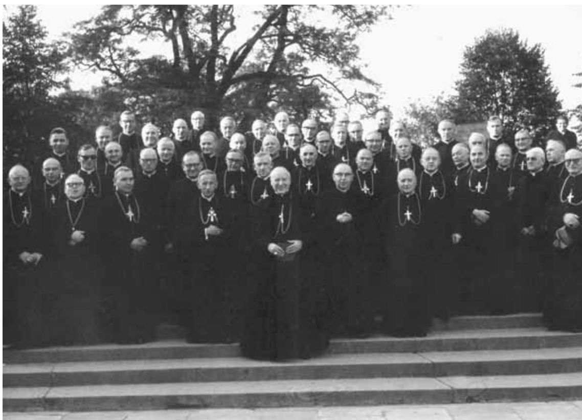
Rekolekcje Episkopatu Polski na Jasnej Górze. Częstochowa, września 1969 r.