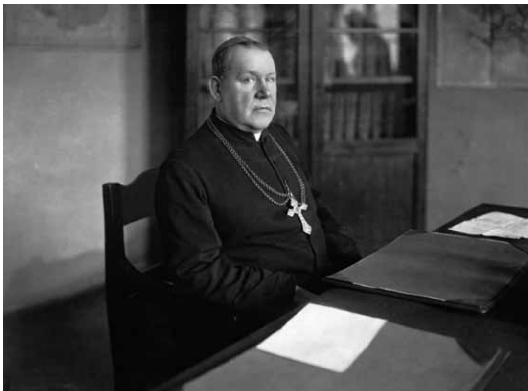
Abp Stanisław Gall, sufragan warszawski.