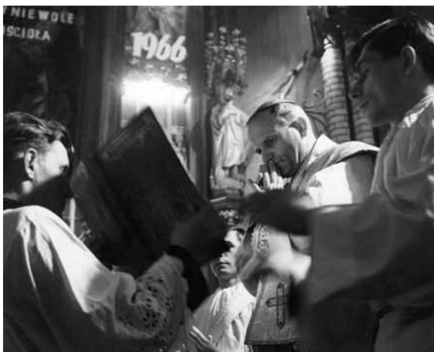
Obchody Tysiąclecia Chrztu Polski w Białymstoku. Metropolita krakowski abp Karol Wojtyła podczas celebracji Mszy Świętej. Białystok, 19 listopada 1966 r.