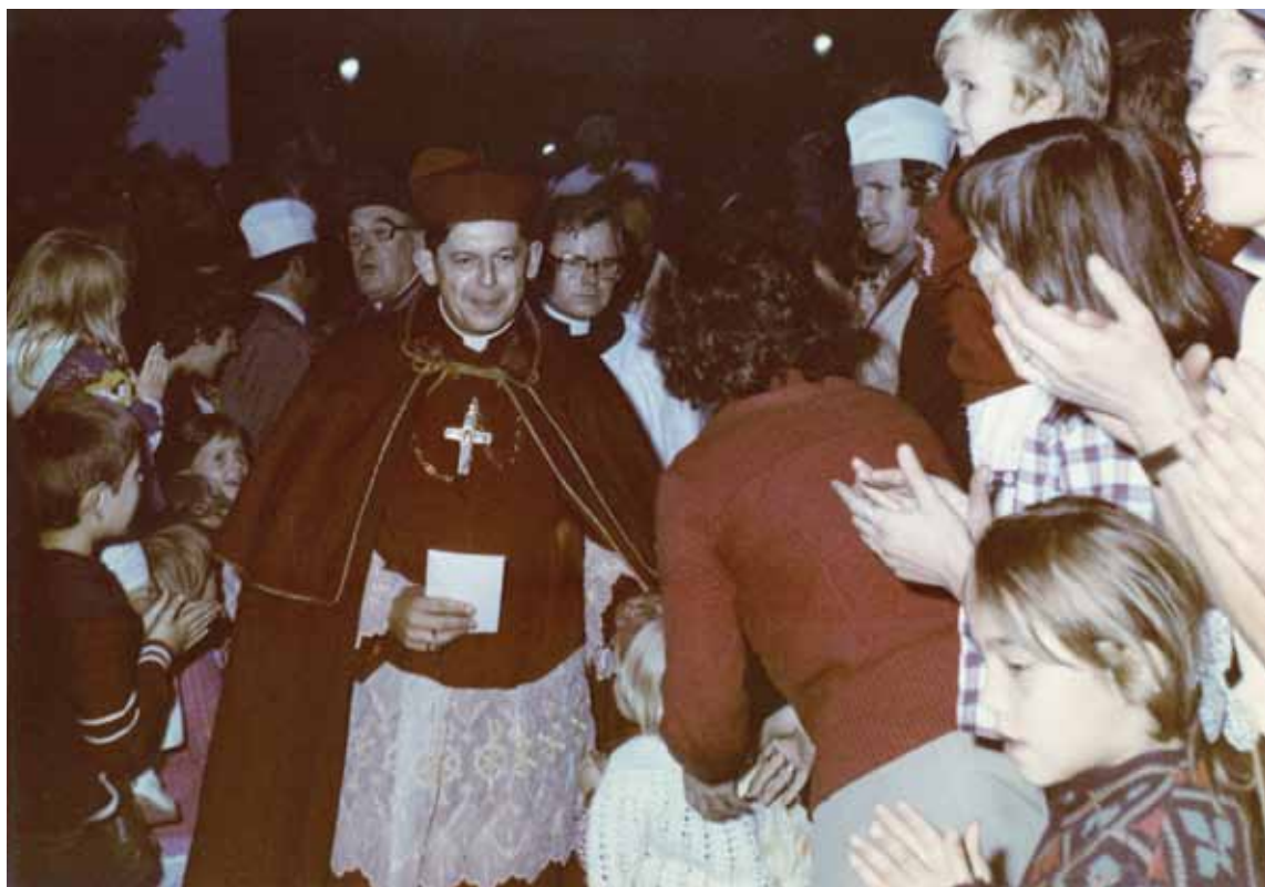
Ingres prymasa Józefa Glempa do archikatedry gnieźnieńskiej. Gniezno, 13 września 1981 r.