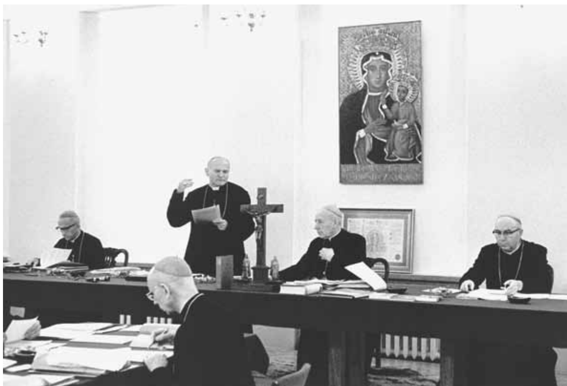
Konferencja Plenarna Episkopatu Polski. Od lewej: abp Antoni Baraniak, przemawiający kard. Karol Wojtyła, kard. Stefan Wyszyński, abp Bolesław Kominek. Warszawa, 13-14 września 1973 r.