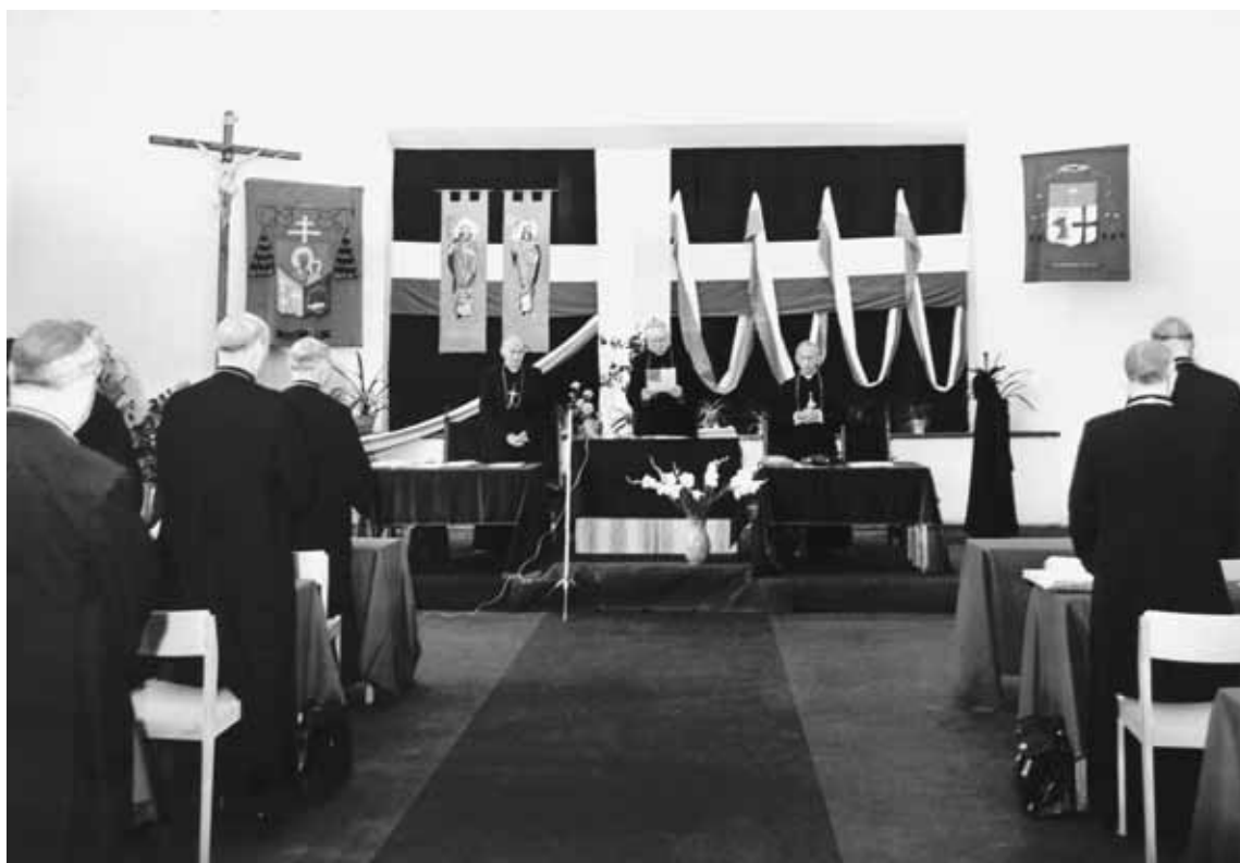
144. Zebranie Plenarne Konferencji Episkopatu Polski w Szczecinie. Uroczystości jubileuszowe 850-lecia Chrztu Pomorza Zachodniego. Sesja naukowa. Szczecin, 7-8 września 1974 r.