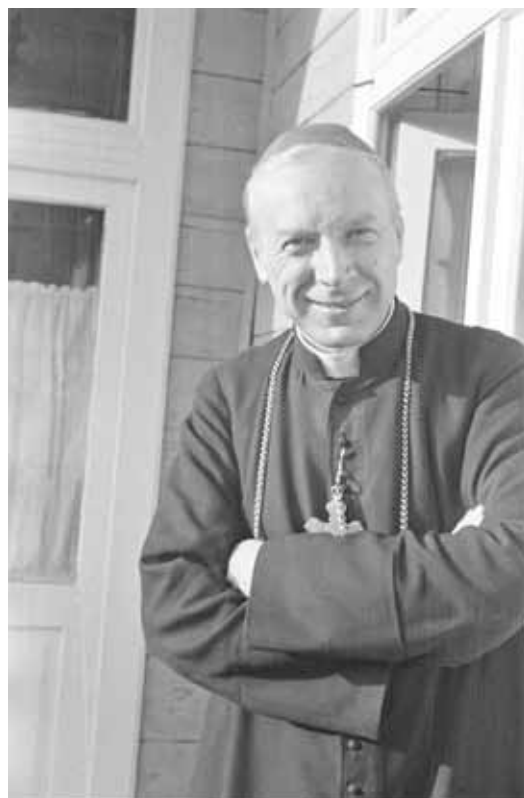
Kard. Stefan Wyszyński podczas internowania w Komańczy.