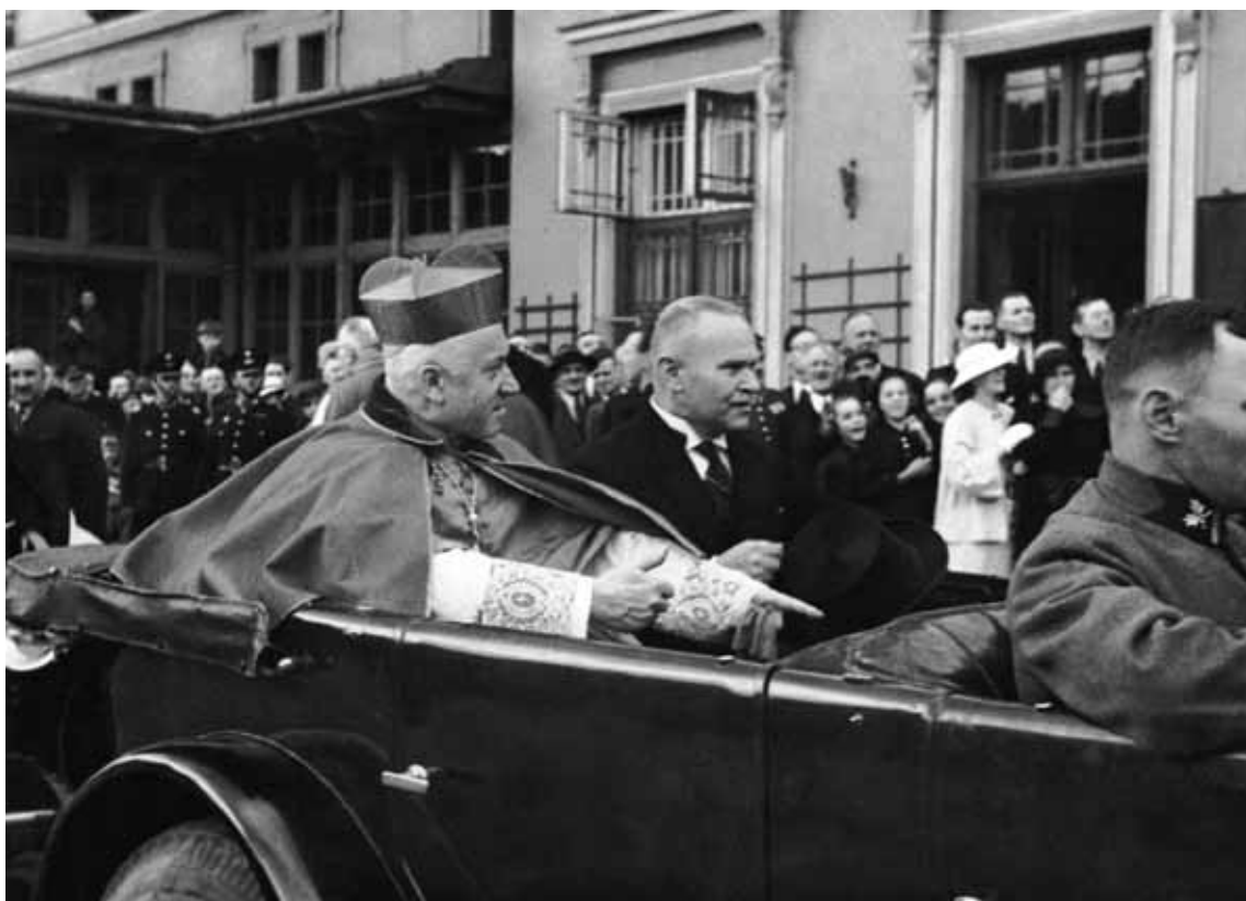
Plenarny Synod Biskupów Polskich na Jasnej Górze. Prymas Polski kard. August Hlond w samochodzie przed budynkiem dworca podczas powitania. Częstochowa, sierpień 1936 r.