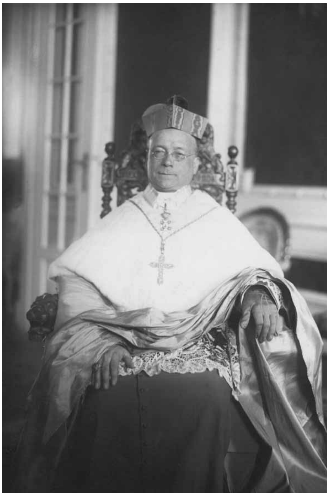
Abp Francesco Marmaggi, nuncjusz apostolski w Polsce.