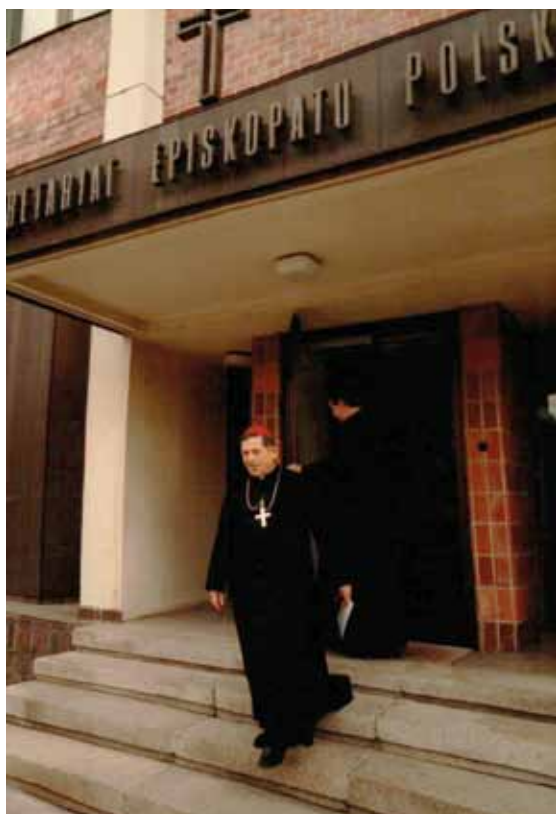
Kard. Józef Glemp na tle wejścia do Sekretariatu Konferencji Episkopatu Polski.