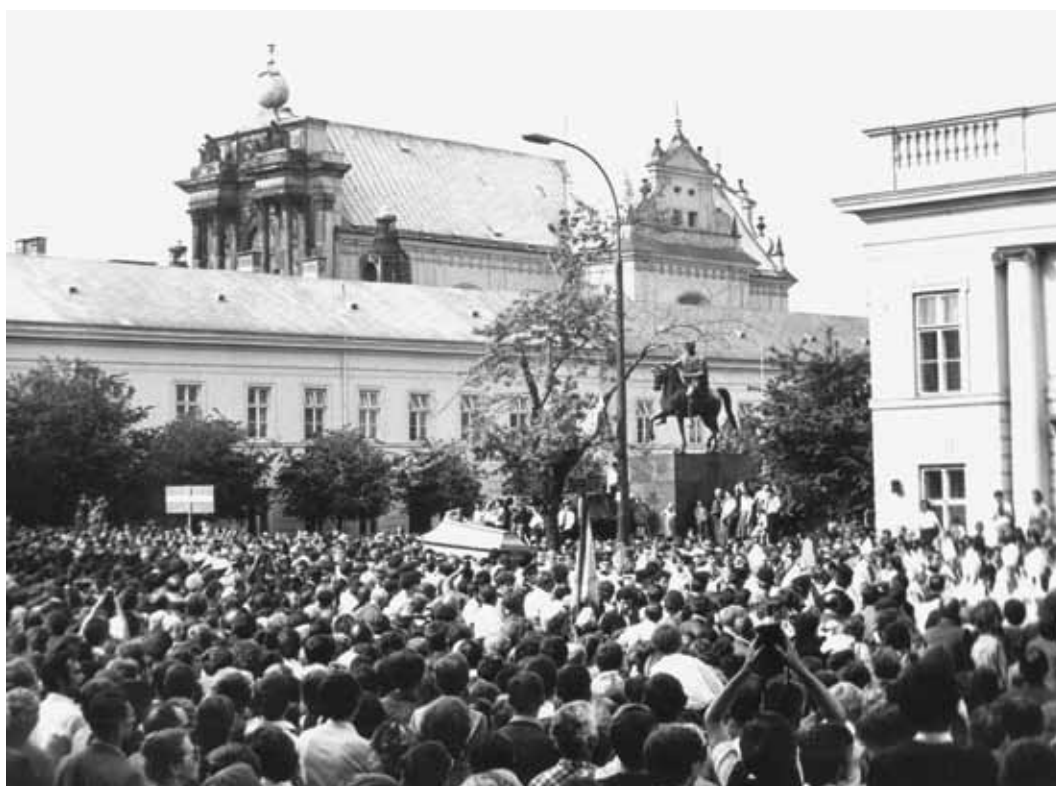
Uroczystości pogrzebowe kard. Stefana Wyszyńskiego, prymasa Polski. Warszawa, 28-31 maja 1981 r.