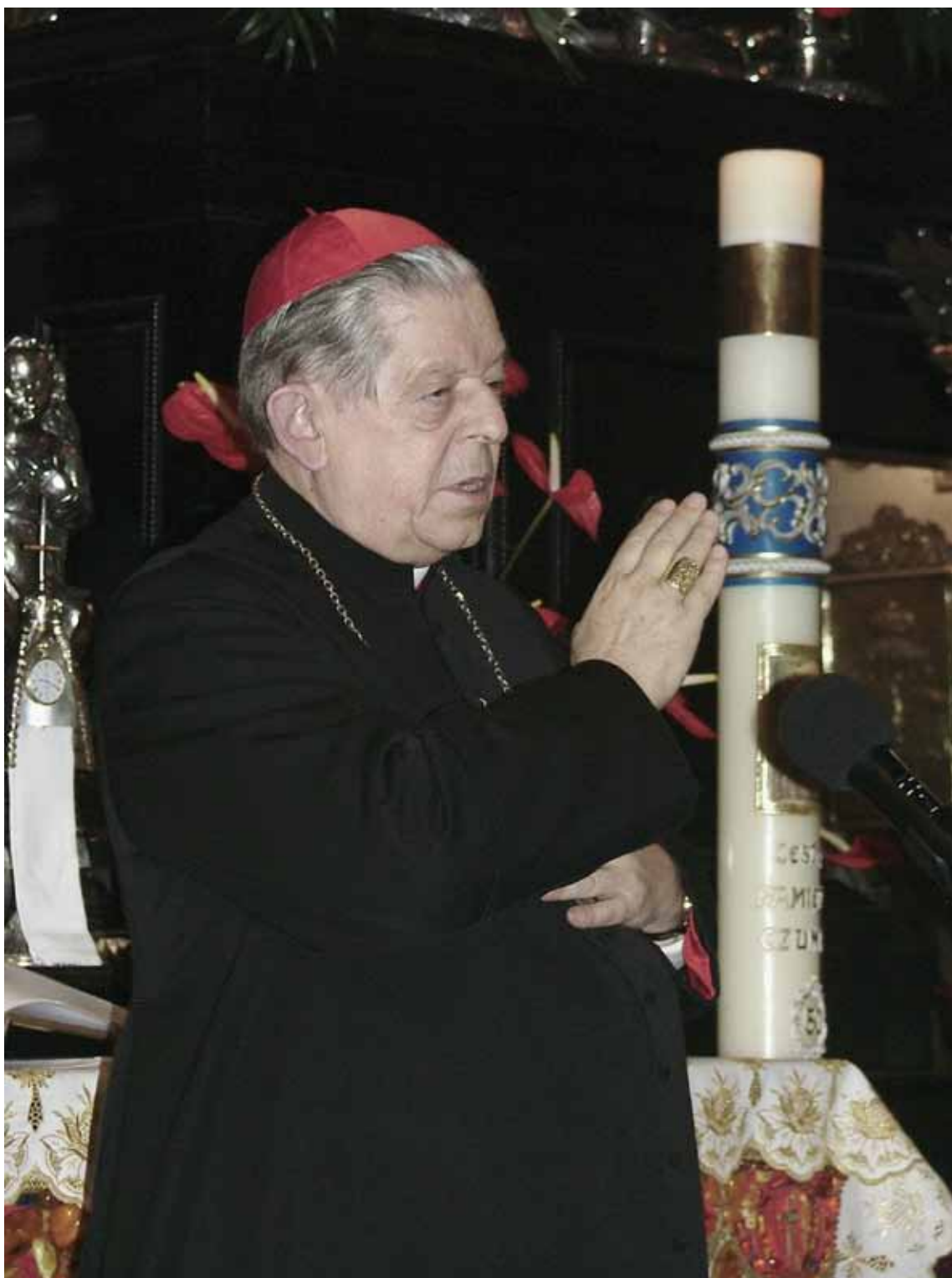
330. Zebranie Plenarne Konferencji Episkopatu Polski. Kard. Józef Glemp udziela błogosławieństwa po Apelu Jasnogórskim. Częstochowa, 25-26 listopada 2004 r.