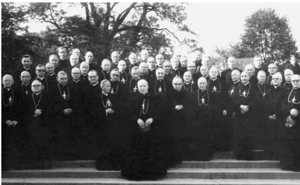
Rekolekcje Episkopatu Polski na Jasnej Górze. Częstochowa, września 1969 r.