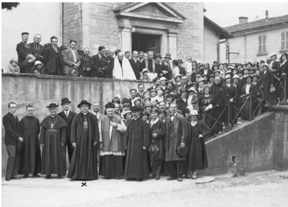
Wizyta kard. Augusta Hlonda we Francji. Prymas Polski wśród uczestników polskiej pielgrzymki przed kościołem w Ars, Ars, Francja, 1934 r.