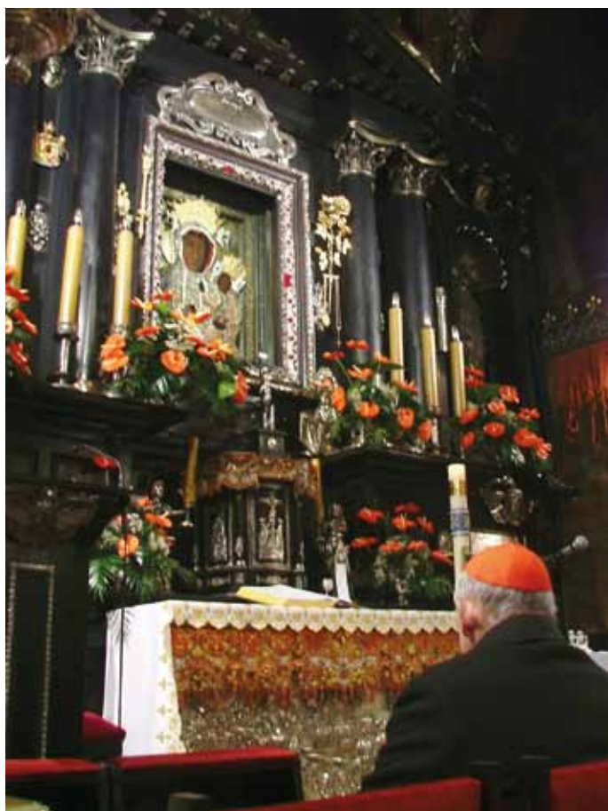
Kard. Józef Glemp w kaplicy Cudownego Obrazu Matki Bożej Jasnogórskiej podczas Konferencji Plenarnej Episkopatu Polski. Częstochowa, 25-26 listopada 2004 r.