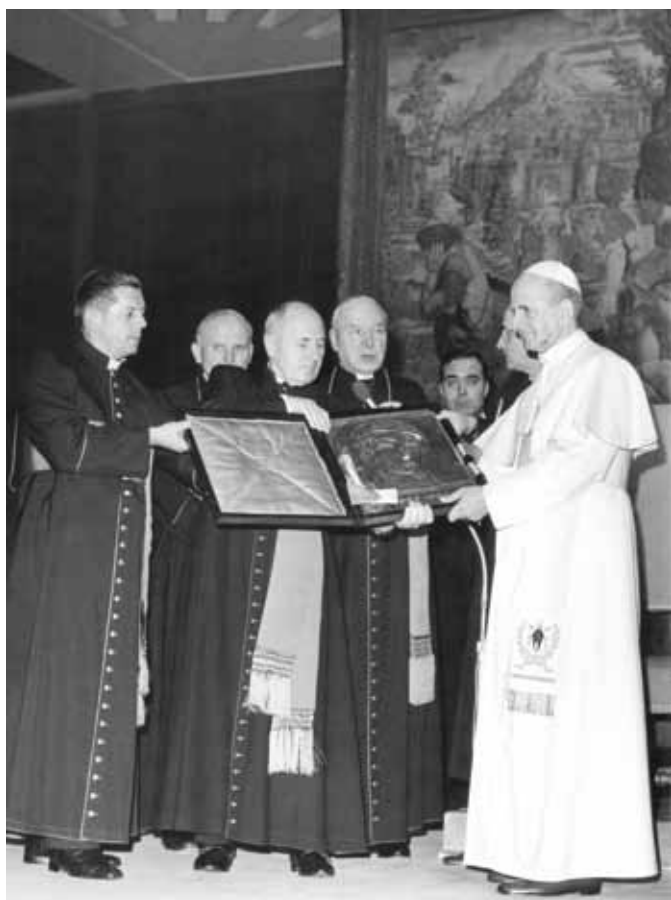
Audiencja u Ojca Świętego Pawła VI. Rzym, 11 października 1975 r.