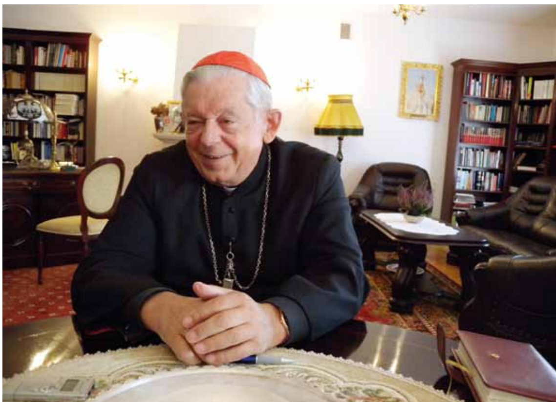
Prymas senior kard. Józef Glemp w swoim mieszkaniu.