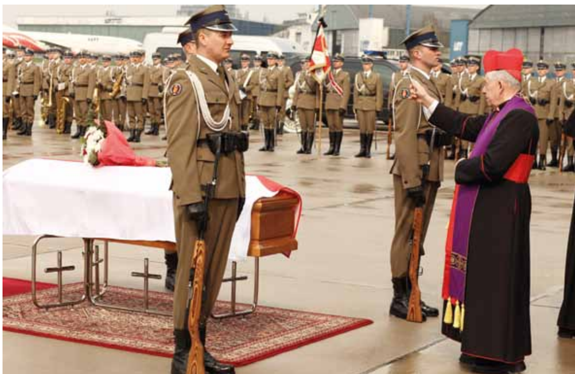
Czwarty dzień żałoby narodowej w Warszawie po katastrofie lotniczej w Smoleńsku. Przylot samolotu z ciałem Marii Kaczyńskiej. Prymas senior kard. Józef Glemp święci trumnę na płycie Lotniska Wojskowego Okęcie. Warszawa, 10 kwietnia 2010 r.