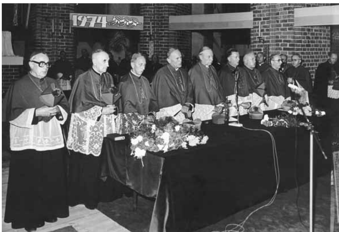
144. Zebranie Plenarne Konferencji Episkopatu Polski w Szczecinie. Uroczystości jubileuszowe 850-lecia Chrztu Pomorza Zachodniego. Sesja naukowa. Szczecin, 7-8 września 1974 r.